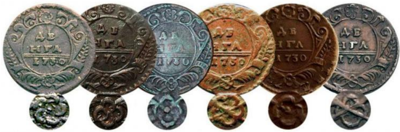
МОНЕТЫ ДЕНГА 1730 года

Денга (деньга) - русская серебряная монета, вошедшая в обращение в конце XIII в. Разные удельные княжества чеканили свои денги. 200 московских денег составляли рубль. С начала XVI в. 2 денги равнялись 1 копейке. Половина денги называлась полушкой .