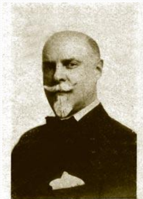
Композиторъ Антонъ ЭЙХЕНВАЛЬДЪ. (къ его концертамъ въ Парижѣ)

Свой вклад в фольклористику внесли и некоторые из живших здесь композиторов.