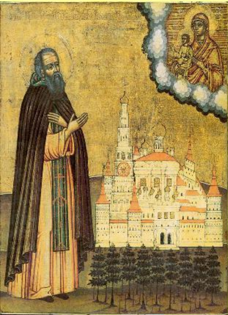
Преподобный Иосиф Волоцкий