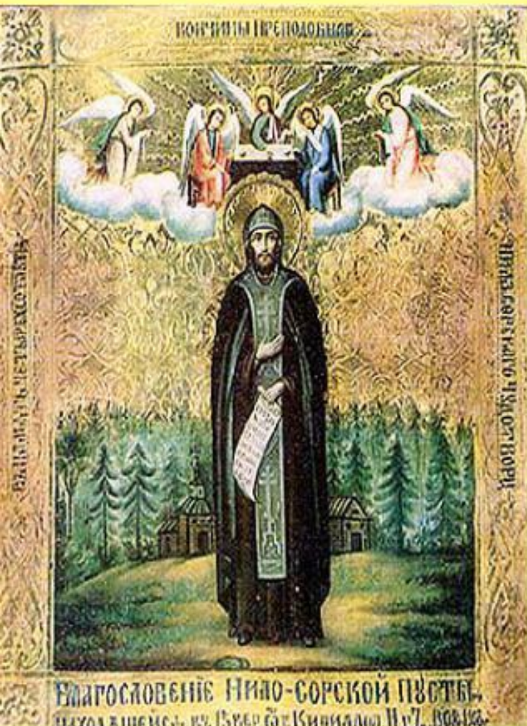
Икона преподобного Нила Сорского

«И ты, господине Иосифе, почто не испытаеть своей святости – не связа Кассиана архимандрита своею мантиею, донеже бы он сгорел, а ты в пламени его, связа, держал? И мы бы тебя, яко единого из трех отрок из пламени вышедша, приняли!»