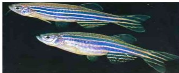
Аквариумная рыбка Brachydanio rerio