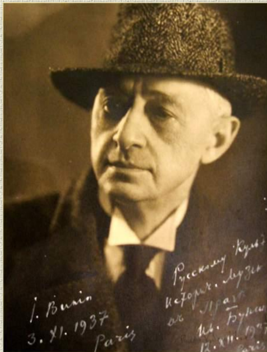
И.А.Бунин в эмиграции

«Все мы Россию, наше русское естество унесли с собою, и где бы мы ни были, она в нас, в наших мыслях и чувствах», – писал Бунин. Чувство Родины особенно сильно проявилось во время войны с гитлеровской Германией. Он не отходил от радио, чтобы узнать правду о продвижении советских войск, а потом записывал услышанное в дневнике