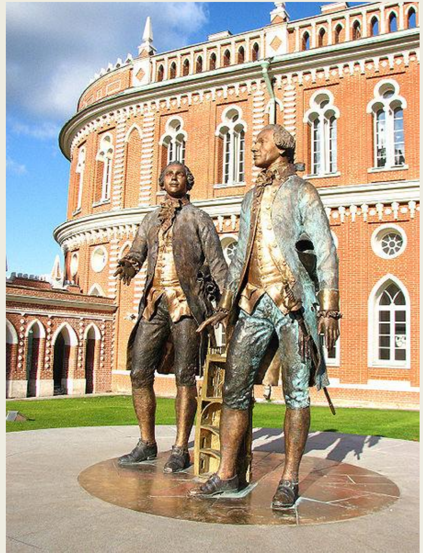
Памятник Василию Баженову и Матвею Казакову в Царицыне работы Леонида Баранова. 2007

Царицыно - недостроенная загородная резиденция императрицы Екатерины II (ныне в черте г. Москвы). Заложена по повелению императрицы Екатерины II в 1776 году . Архитекторы - Баженов и Казаков. Стиль, в котором построен ансамбль Царицыно получил название «Русская готика» или «Неоготика», «Псевдоготика».