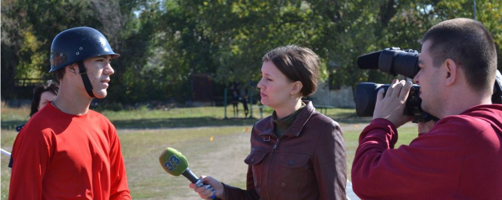
Сотрудничество со СМИ Аксайского района и Ростовской области