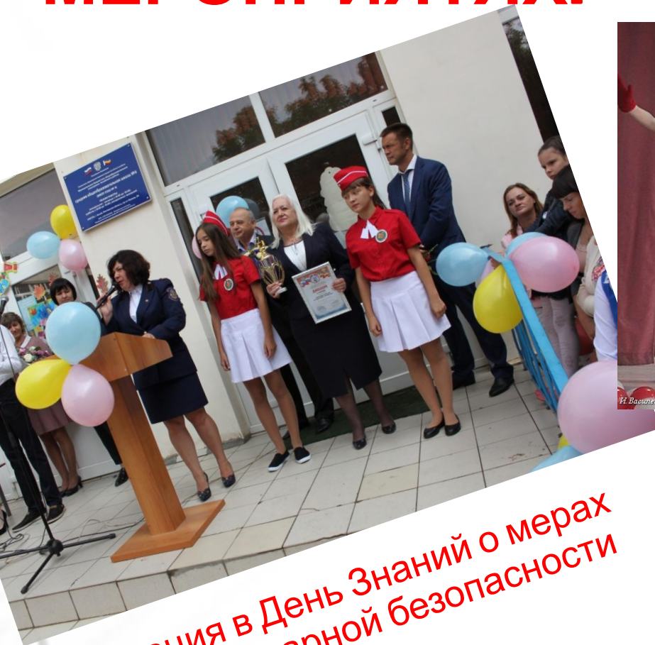
Агитация в День Знаний о мерах противопожарной безопасности