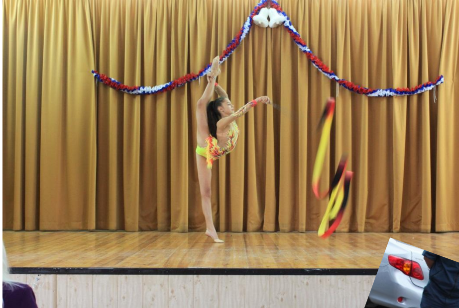
Участие в Дне Добровольца