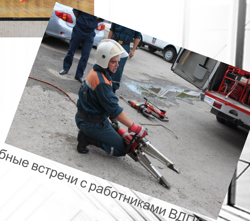
Учебные встречи с работниками ВДПО