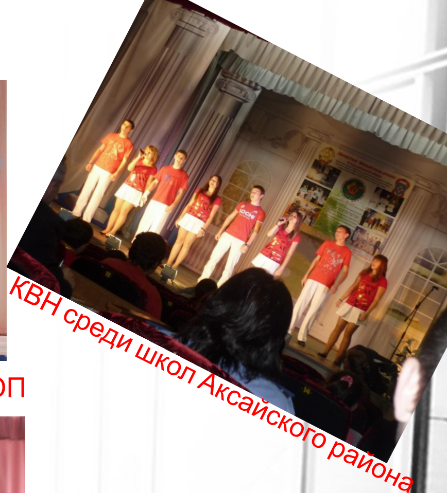
КВН среди школ Аксайского района