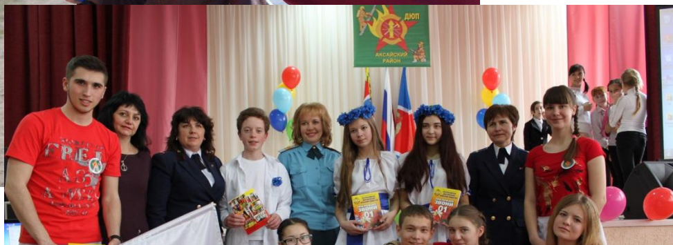
Выступления на Международных конкурсах «Мы с пожарными друзья!»