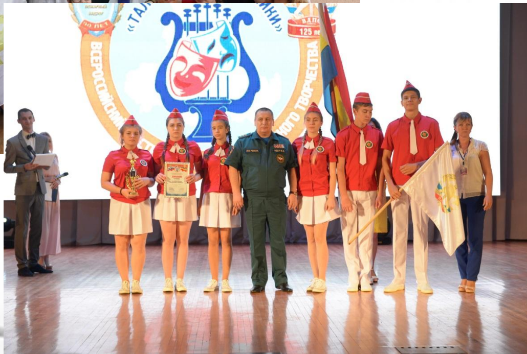
Выступление на Всероссийском фестивале «Таланты и поклонники»