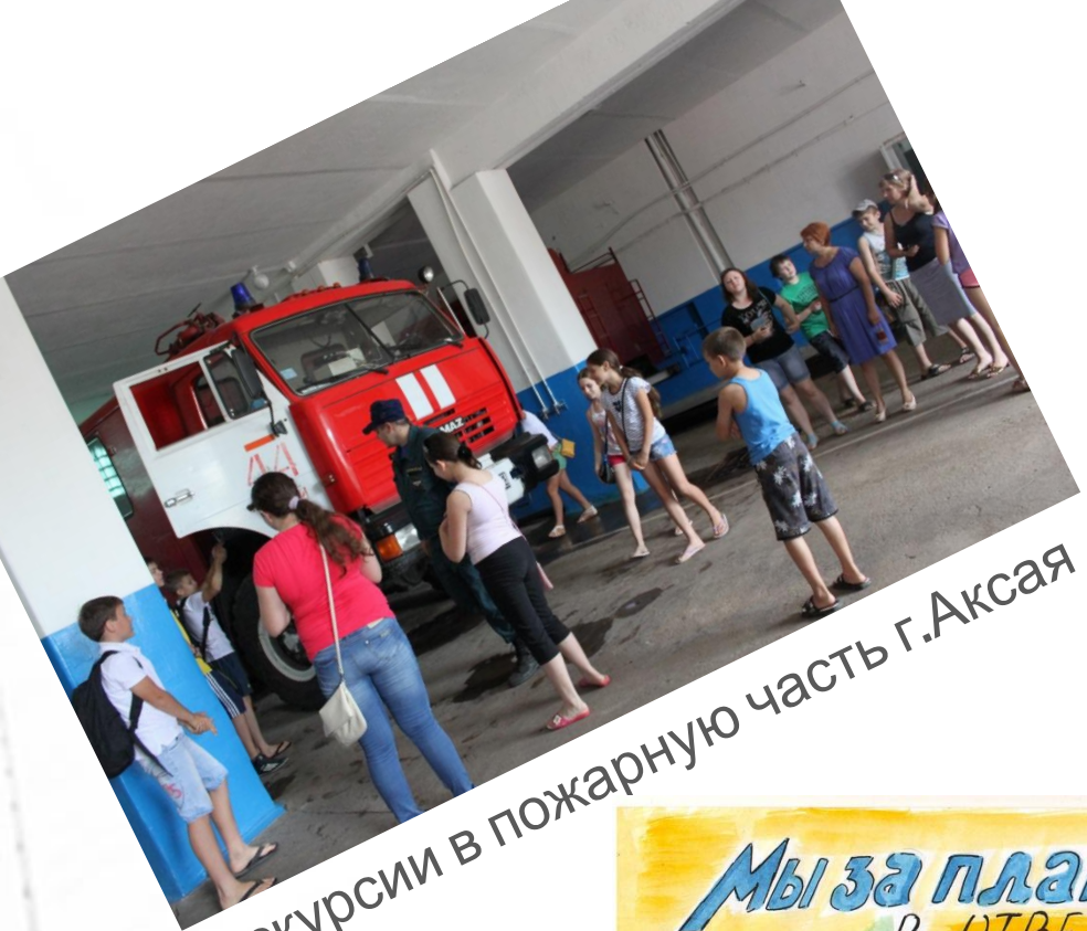
Экскурсии в пожарную часть г.Аксая