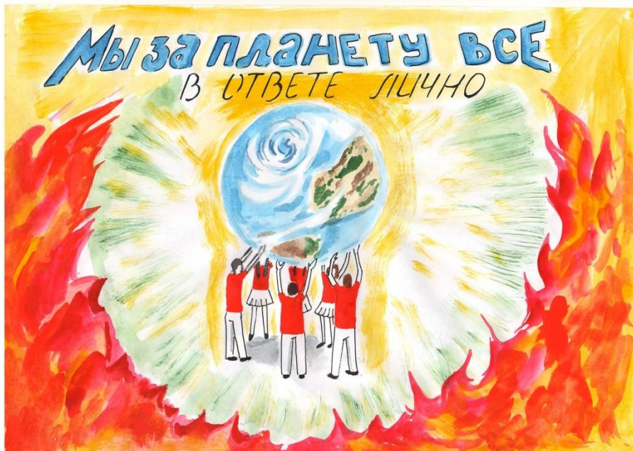
Участие в конкурсе рисунков