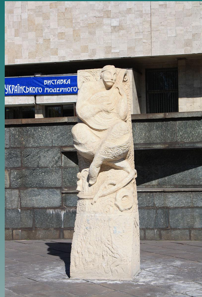
Пам'ятник козаку Мамаю в Дніпродзержинську.