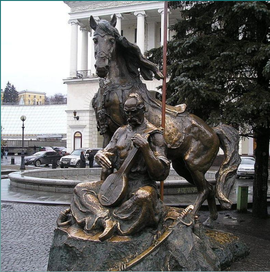
Київ, площа Незалежності Пам'ятник козаку Мамаю. 2003