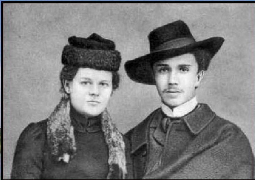
Оксана Косач (молодша сестра Лесі Українки) та її чоловік Юрій Тесленко-Приходько. Фото 1903 р.