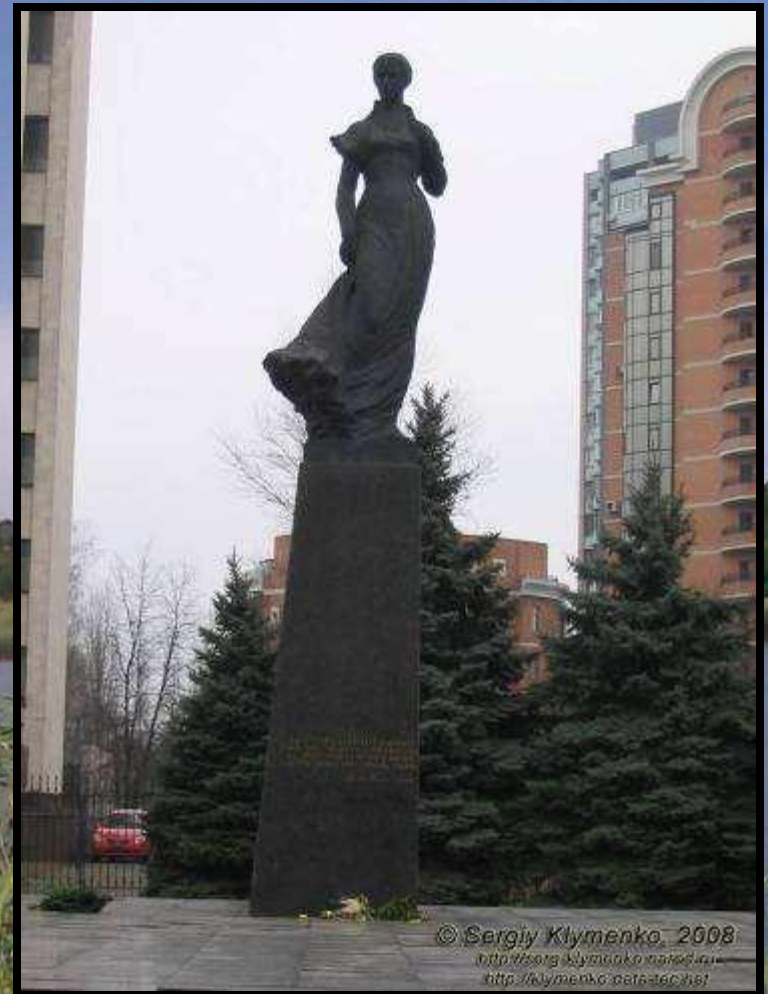
Пам'ятник у Києві