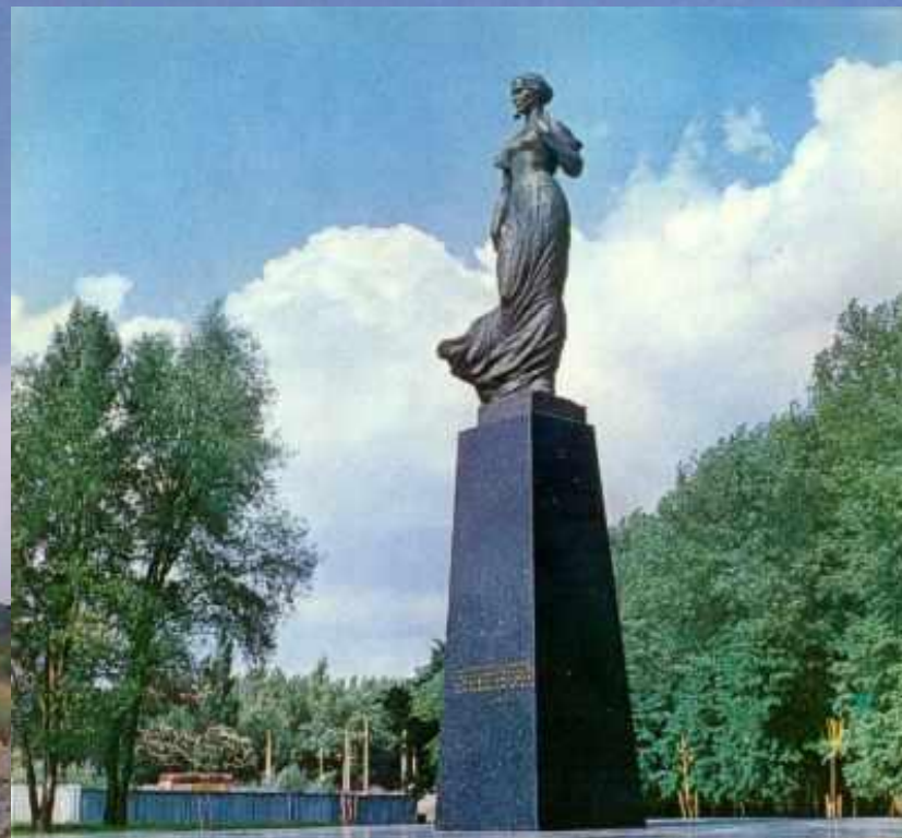
Пам'ятник Лесі Українці в Києві (площа Лесі Українки). Скульптор Г.Н.Кальченко, архітектор А.Ф.Ігнащенко. Встановлено в 1973 р.