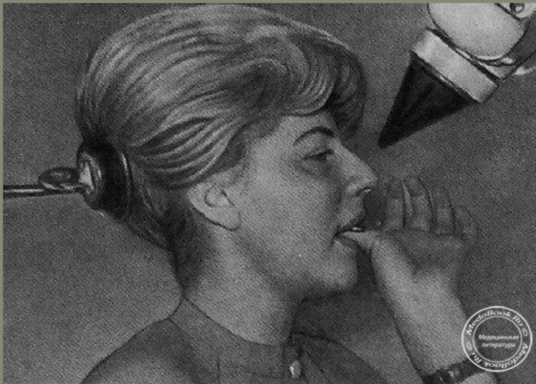
Жоғарғы жақтың орталық күрек тісі ауызішілік рентгенографиясы