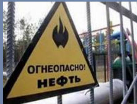
«Факелы» нефтегазовых промыслов