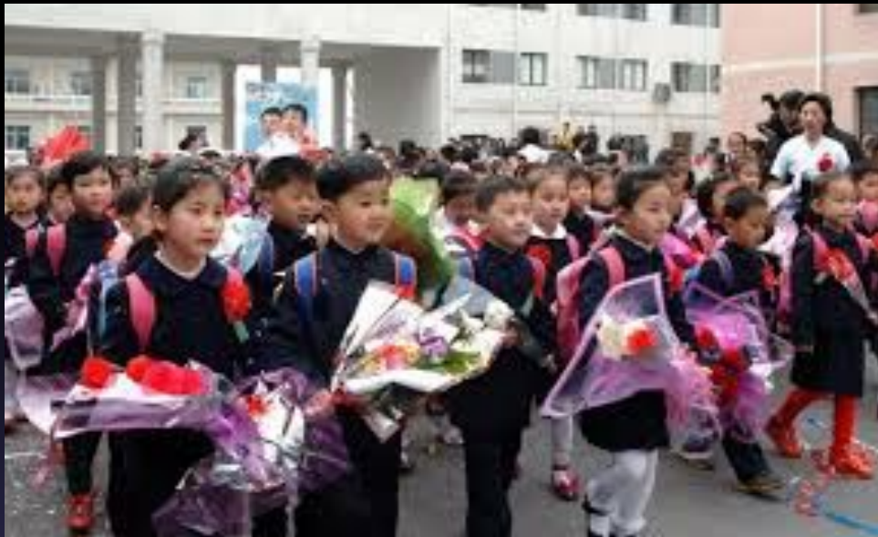
Начальная школа в КНДР