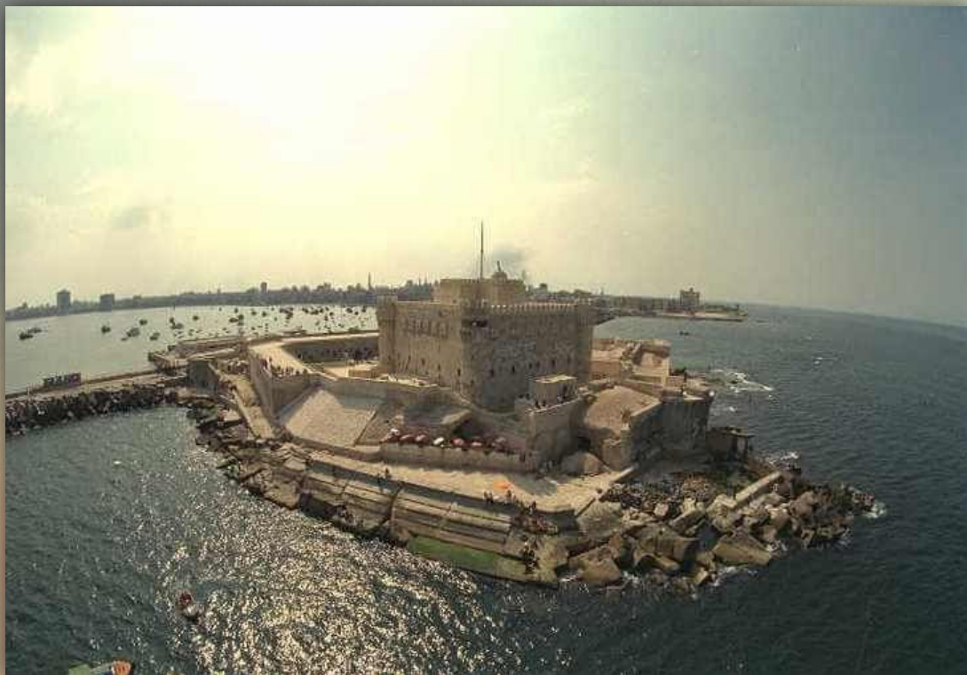
Крепость Кайт Бей