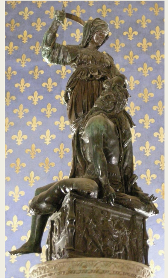
«Юдифь и Олоферн», 1455