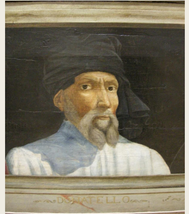
«Портрет Донателло», XVI век. Художник неизвестен