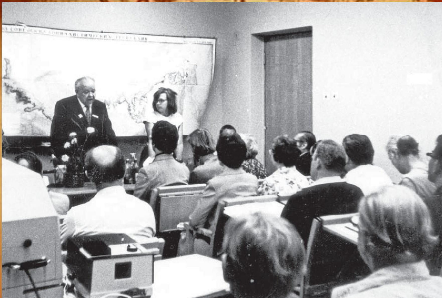
XII международный ботанический конгресс 1975 г., Ленинград