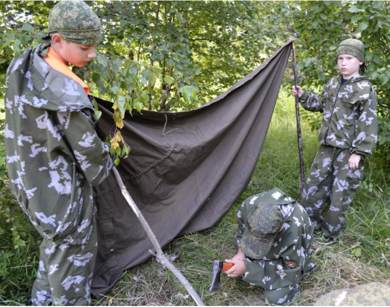
Ориентирование на местности