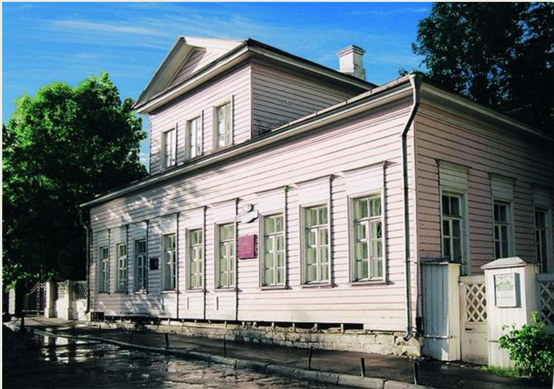
Дом-музей М. Ю. Лермонтова в Москве.