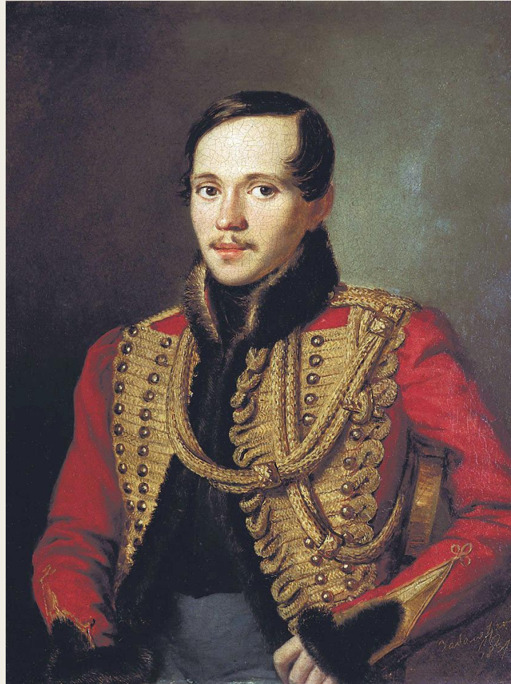
Михаил Юрьевич Лермонтов