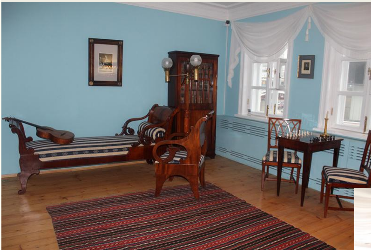
Комната М. Ю. Лермонтова