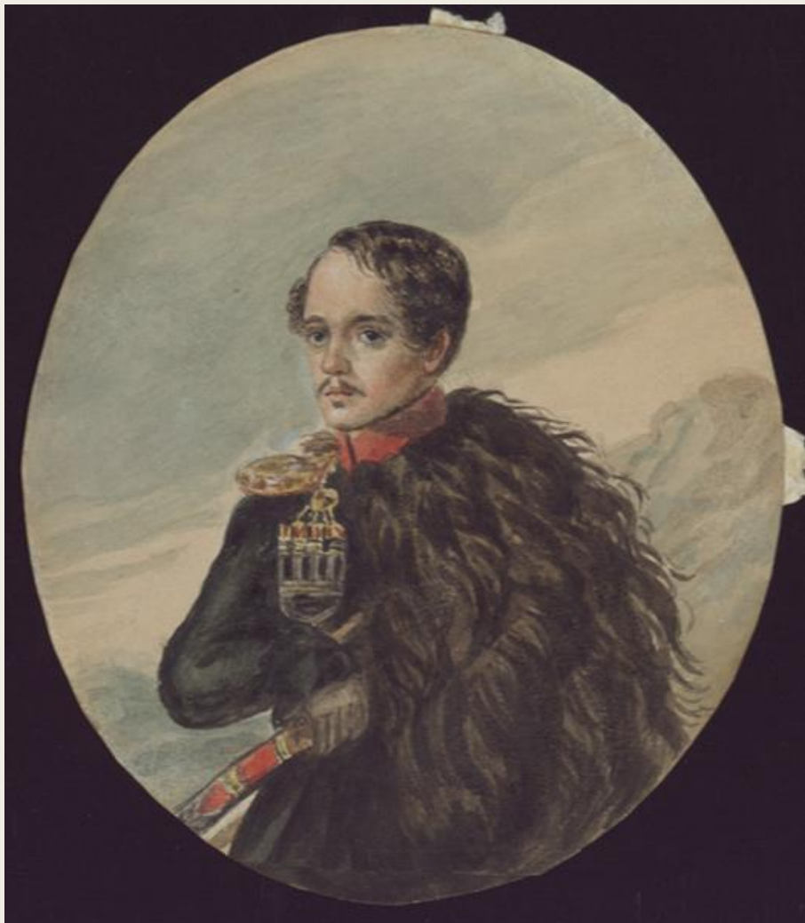
Автопортрет М. Ю. Лермонтова 1837-1838 гг.