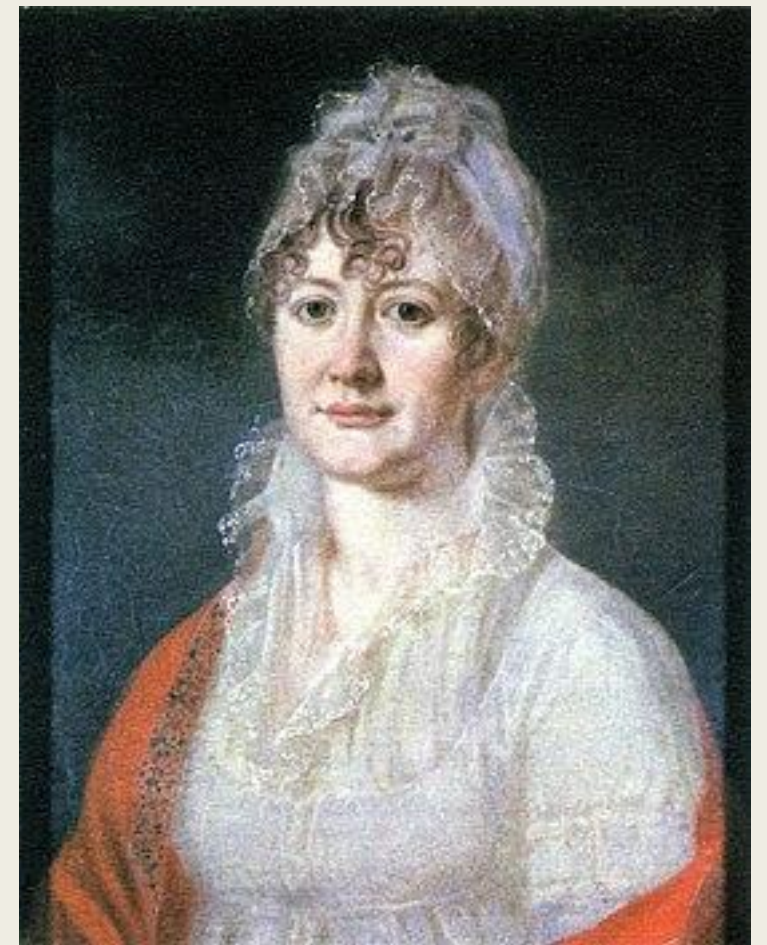
Елизавета Алексеевна Арсеньева