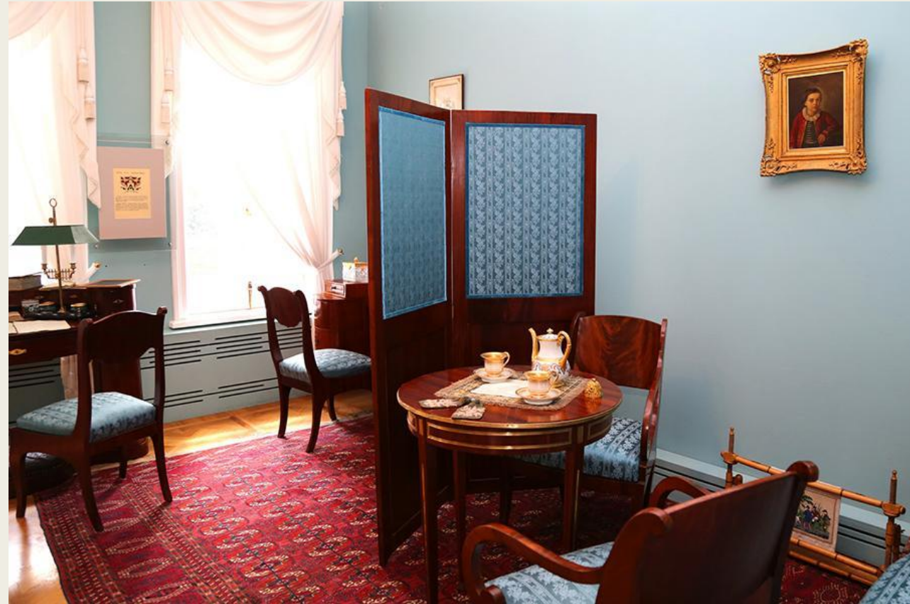
Комната Елизаветы Алексеевны

Мемориальная часть дома представляет собой восстановленные интерьеры московского особняка 1830-х годов, с подобранными по типологии предметами мебели и декоративно-прикладного искусства и материалами лермонтовской коллекции государственного литературного музея, включающей в себя подлинные фамильные портреты, рисунки и картины Лермонтова, книги с его автографами.