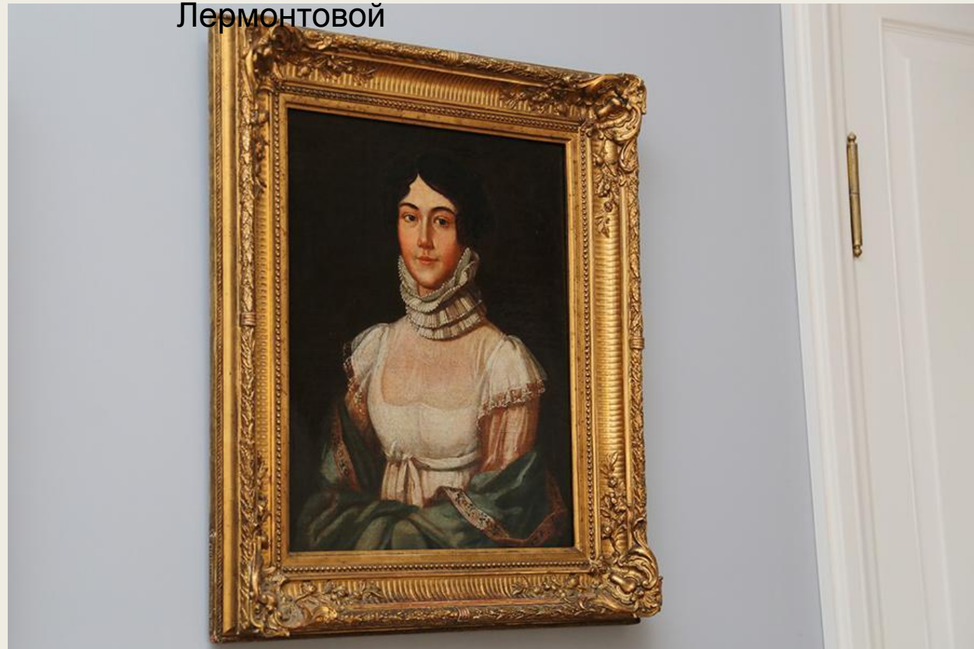
Портрет Марии Михайловны Лермонтовой