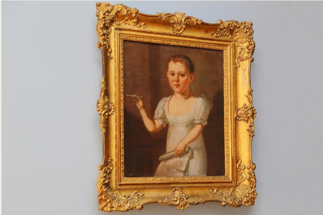
Портрет М. Ю. Лермонтова в детстве