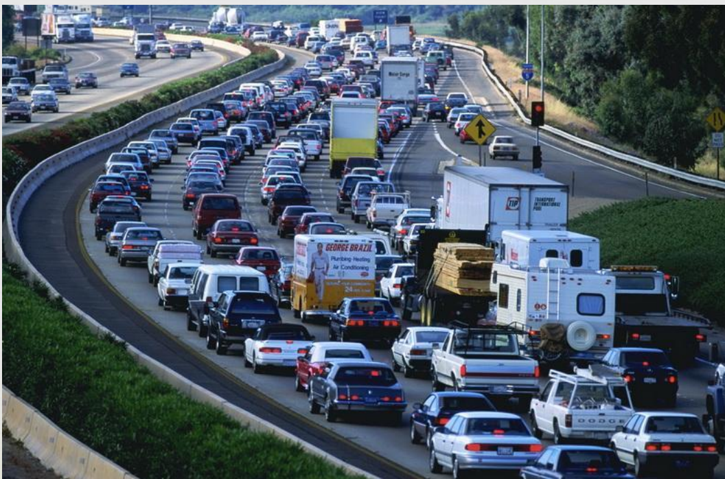
Korek drogowy przez ciężki transport. 30.09.2001. USA

Tworzenie centrów logistycznych może się wiązać również ze złą lokalizacją, która może powodować zatory komunikacyjne, generować przewozy towarowe przez centra miast, niszczyć drogi miejskie nie przystosowane do ciężkiego transportu towarowego.