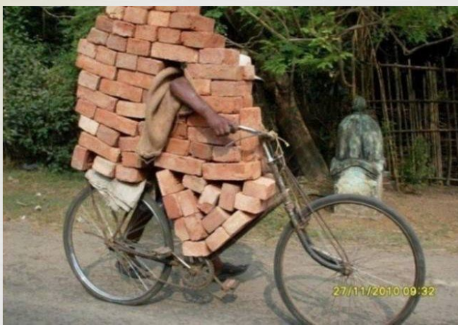
Rozpowszechniony ciężki transport w Indii. 27.11.2010