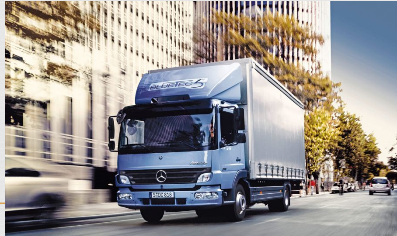
Lieka ciężarówka Mercedes-Benz Atego. 15.10.2011.