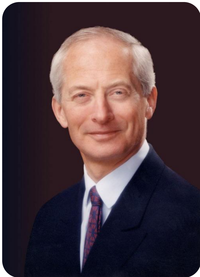
Ханс-Адам II — правящий 15-й князь Лихтенштейна.