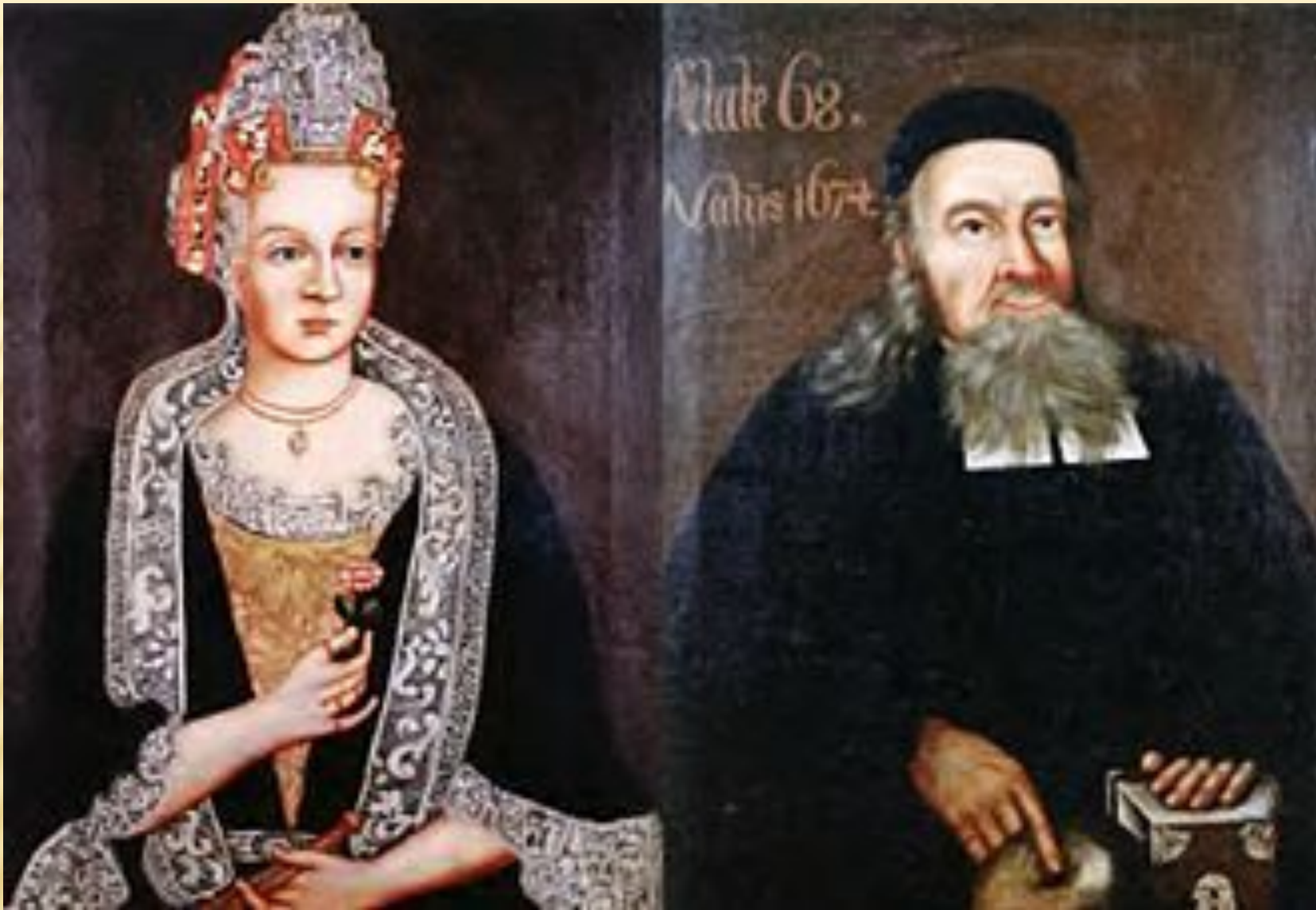
Кристина Бродерсония и Нильс Линней, родители Карла Линнея