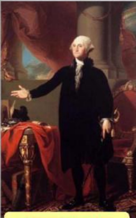
Джордж Вашингтон 1-й президент США

Устанавливался республиканский строй и федеративное устройство