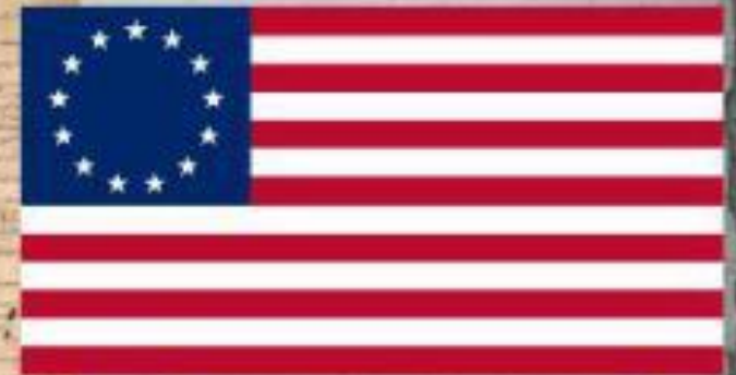
первый флаг США (13 штатов)