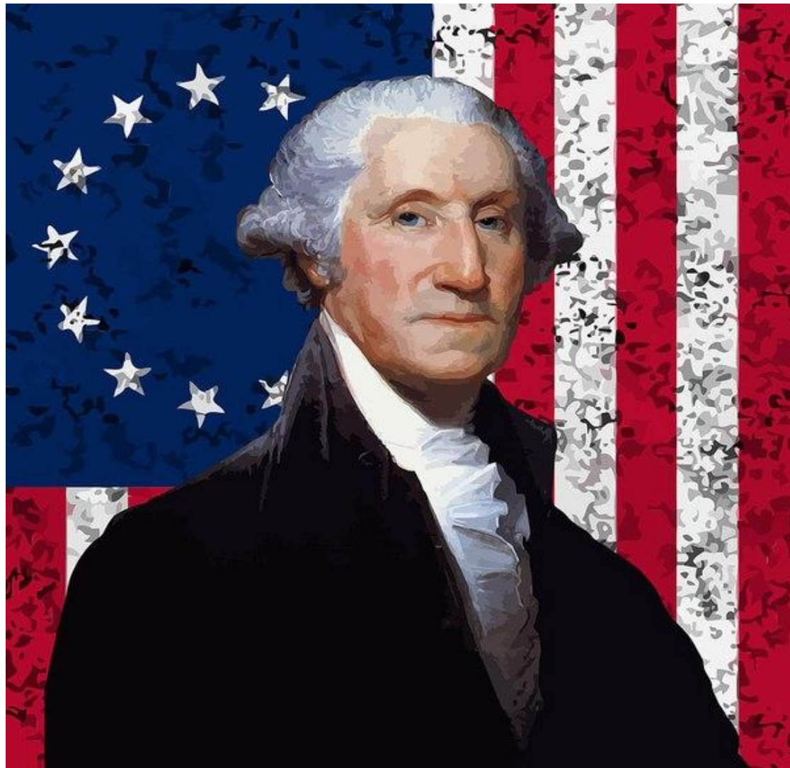
Джордж Вашингтон – главнокомандующий армии колонистов