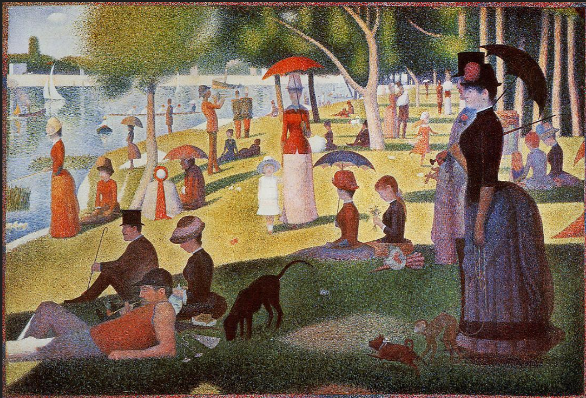
«Воскресный день на острове Гранд-Жатт» (1886)