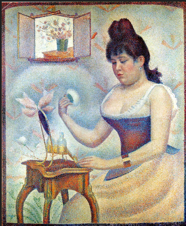
«Пудрящаяся женщина» (1889)