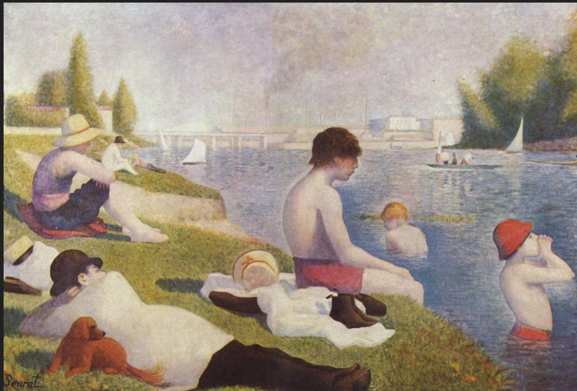
«Купальщики в Аньере» (1883)