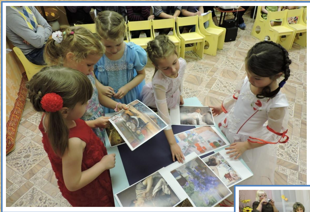
Игра «Найди пейзаж» (участвуют две команды)