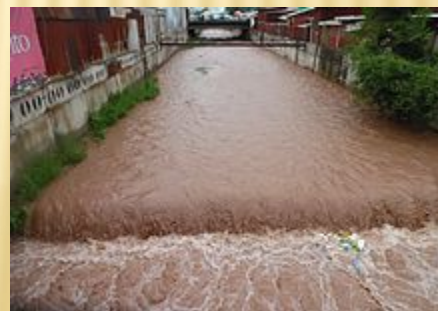
Река Ала Арча