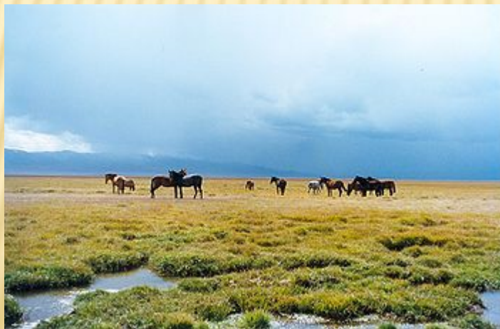
Пастбище у озера Сонкёль