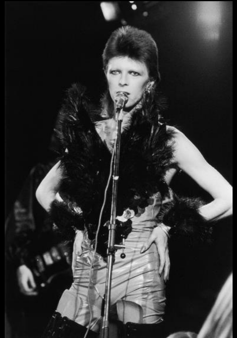
Концерт на телевидении в Лондоне. Дэвид Боуи в костюме «Ангел Смерти», 20 октября 1973.