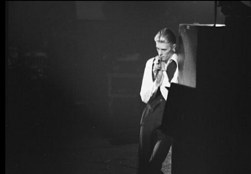
Боуи в образе Белого Герцога, Торонто, 1976 год