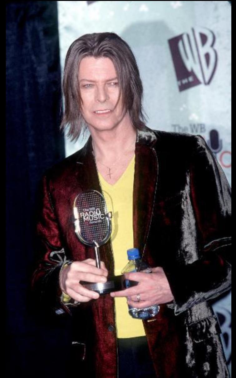
Награда от The WB Radio Music Awards в Лас-Вегасе, 28 октября 2000