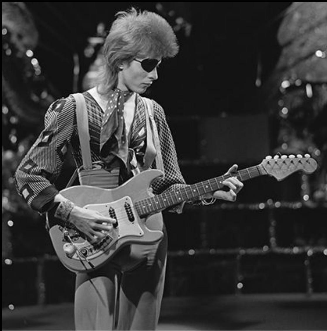
Дэвид Боуи играет свой хит Rebel Rebel, 1974