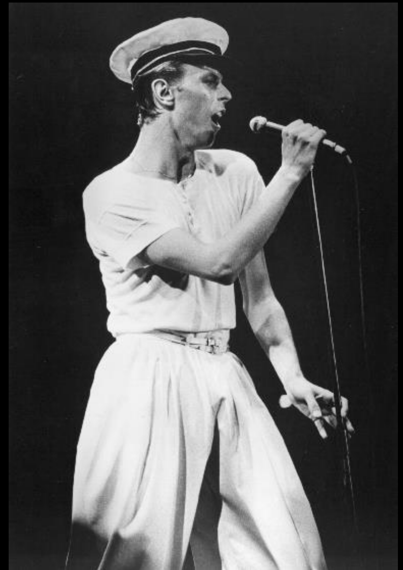
Концерт в рамках тура по Англии, 15 июня 1978.