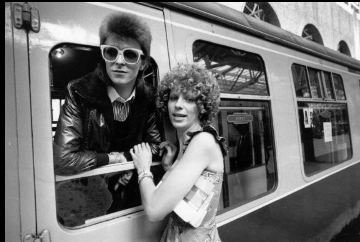
Дэвид Боуи и его жена Энджи, 9 июля 1973.