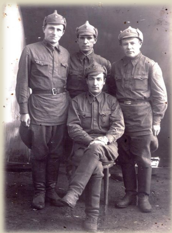
13 октября 1941 год, г. Туймазы, Башкирия