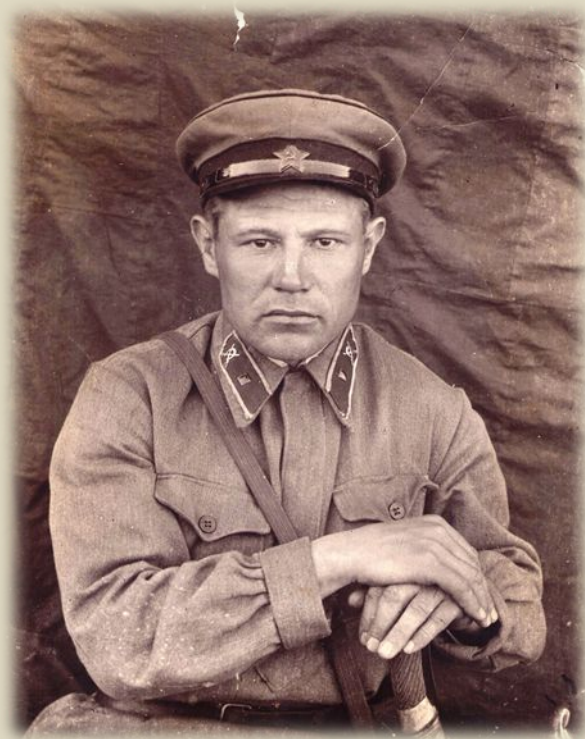
30 мая 1942 год