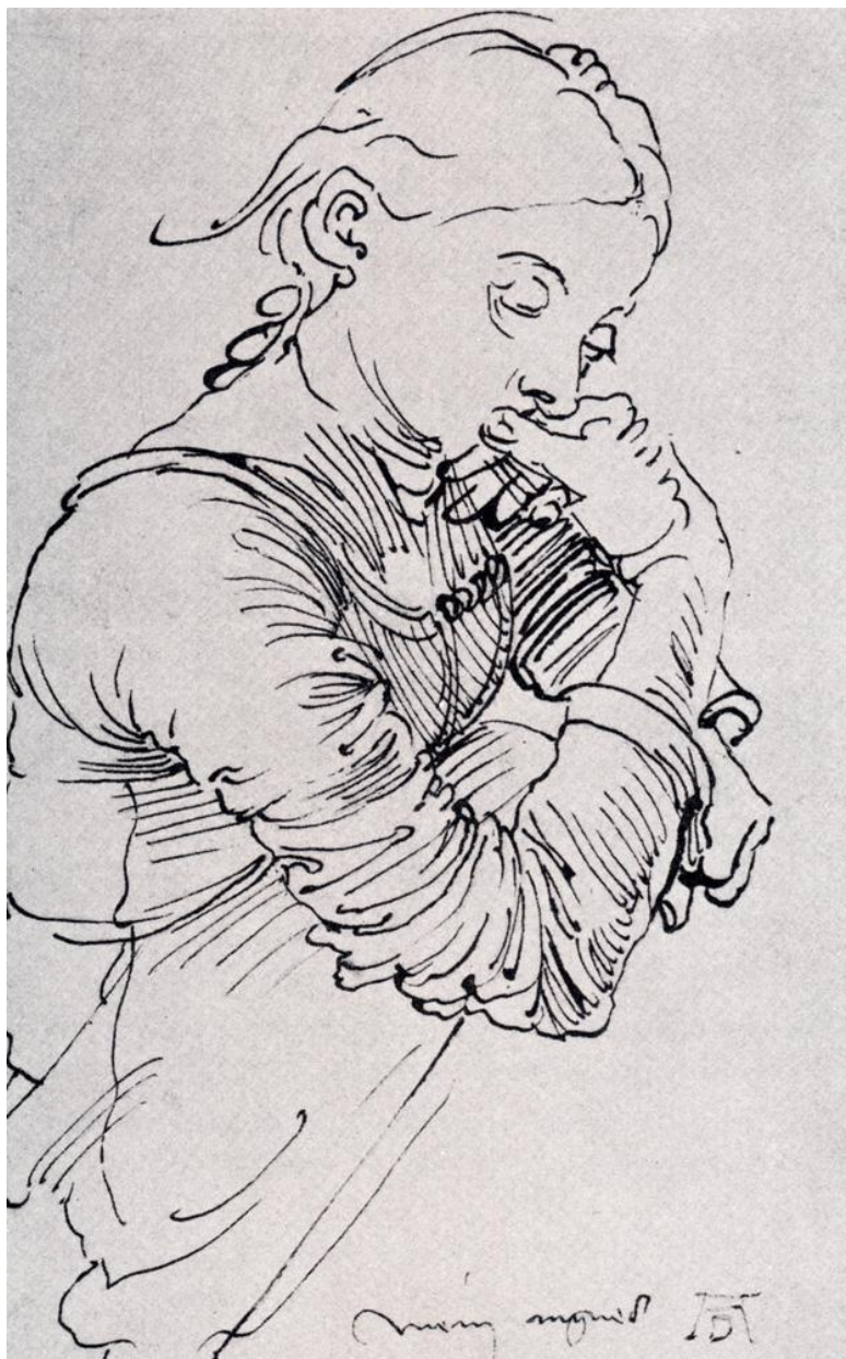
А. Дюрер. Портрет жены