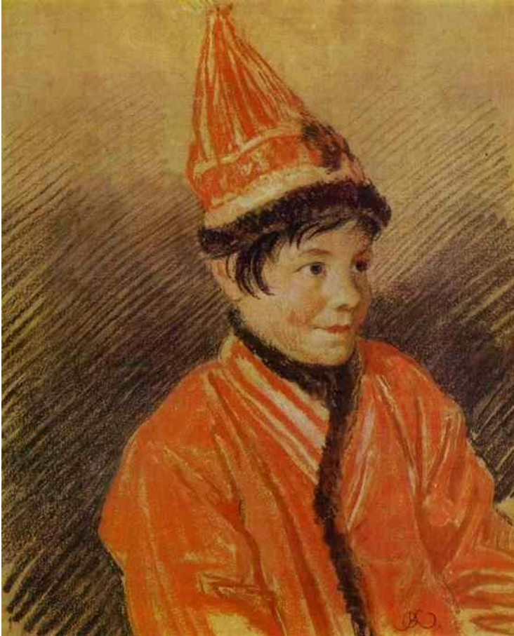
О.А. Кипренский. Портрет калмыцкой девочки. Тоновый рисунок

В портрете девочки главные выразительные средства – тон, пятно. Портрет Бестужева-Рюмина создан одной линией, одним контуром. Тем не менее он тоже выразительный и понятный.