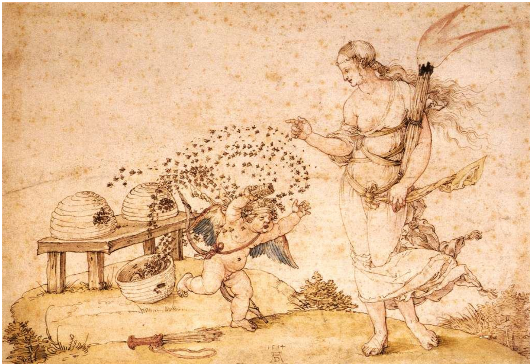
А. Дюрер. Купидон, ворующий мёд. Перо, чернила и акварель на бумаге