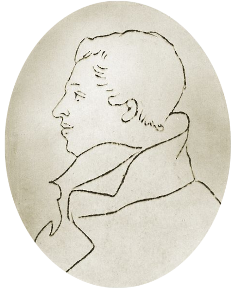
А.А. Ивановский. «М.П. Бестужев-Рюмин» Контурный рисунок