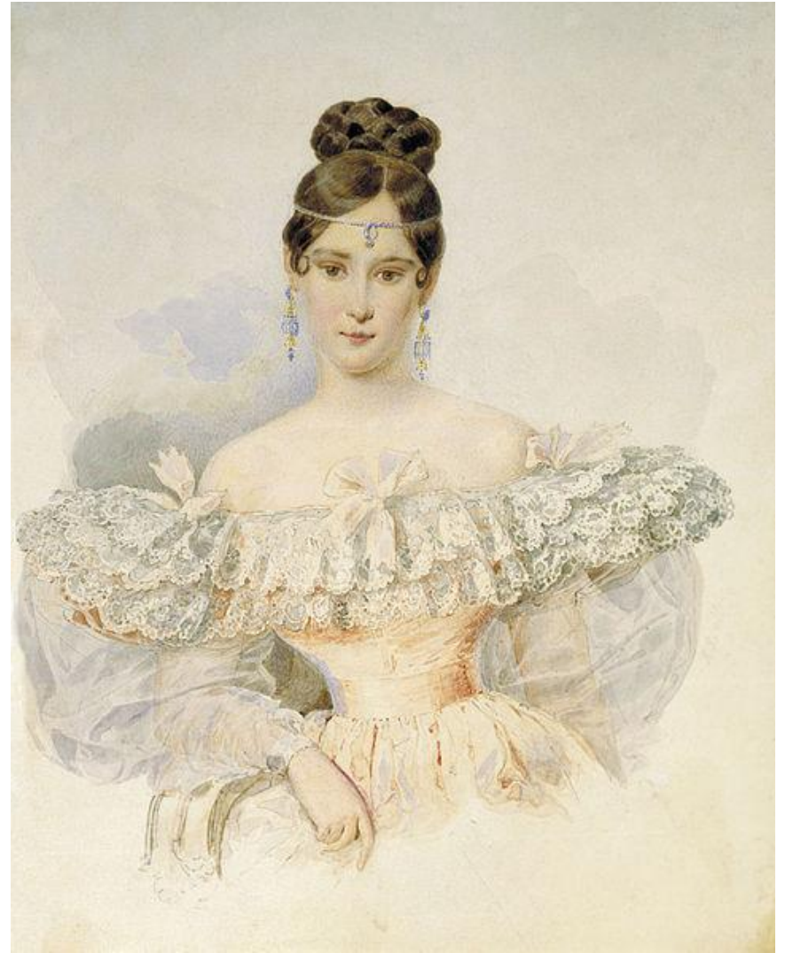
А. Брюллов. Портрет Н.Н. Пушкиной

Акварельным рисункам присущи свежесть и чистота цвета.