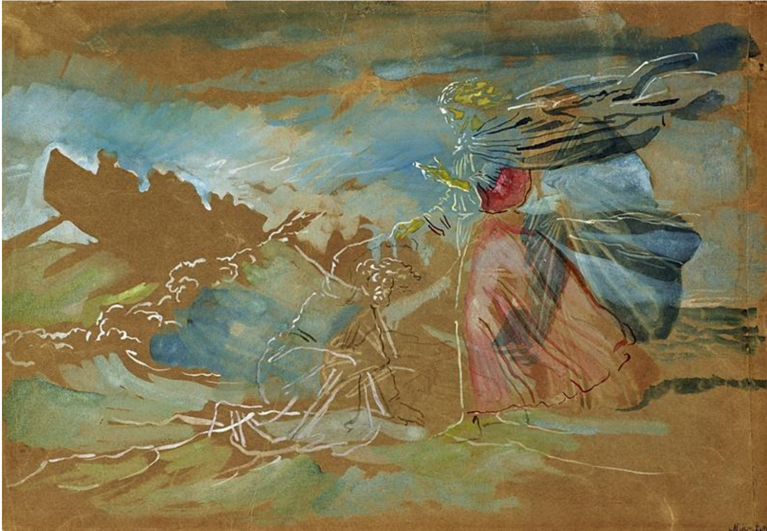
А.А. Иванов. "Хождение по водам". Бумага, акварель, белила.

В этом рисунке лица Христа и апостола Петра даны несколькими мазками краски. Лодка с апостолами – не закрашенное пятно коричневой бумаги.