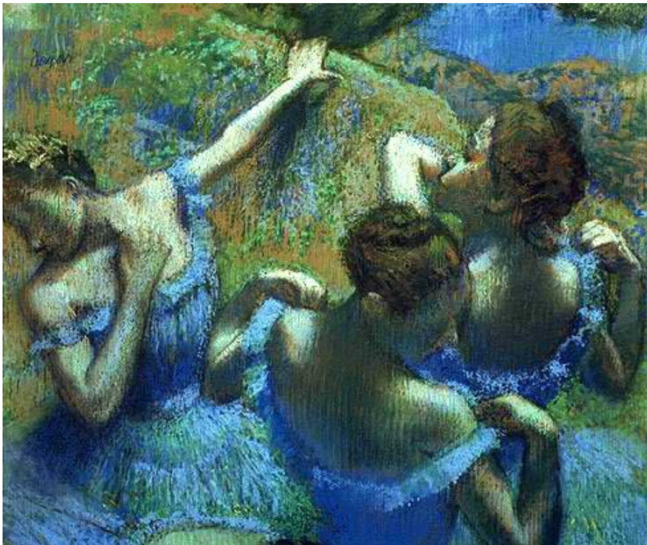
Э. Дега. Голубые танцовщицы.

Когда художники используют в технике ПАСТЕЛИ цвет как основное выразительное средство, это сближает ПАСТЕЛЬ с живописью.