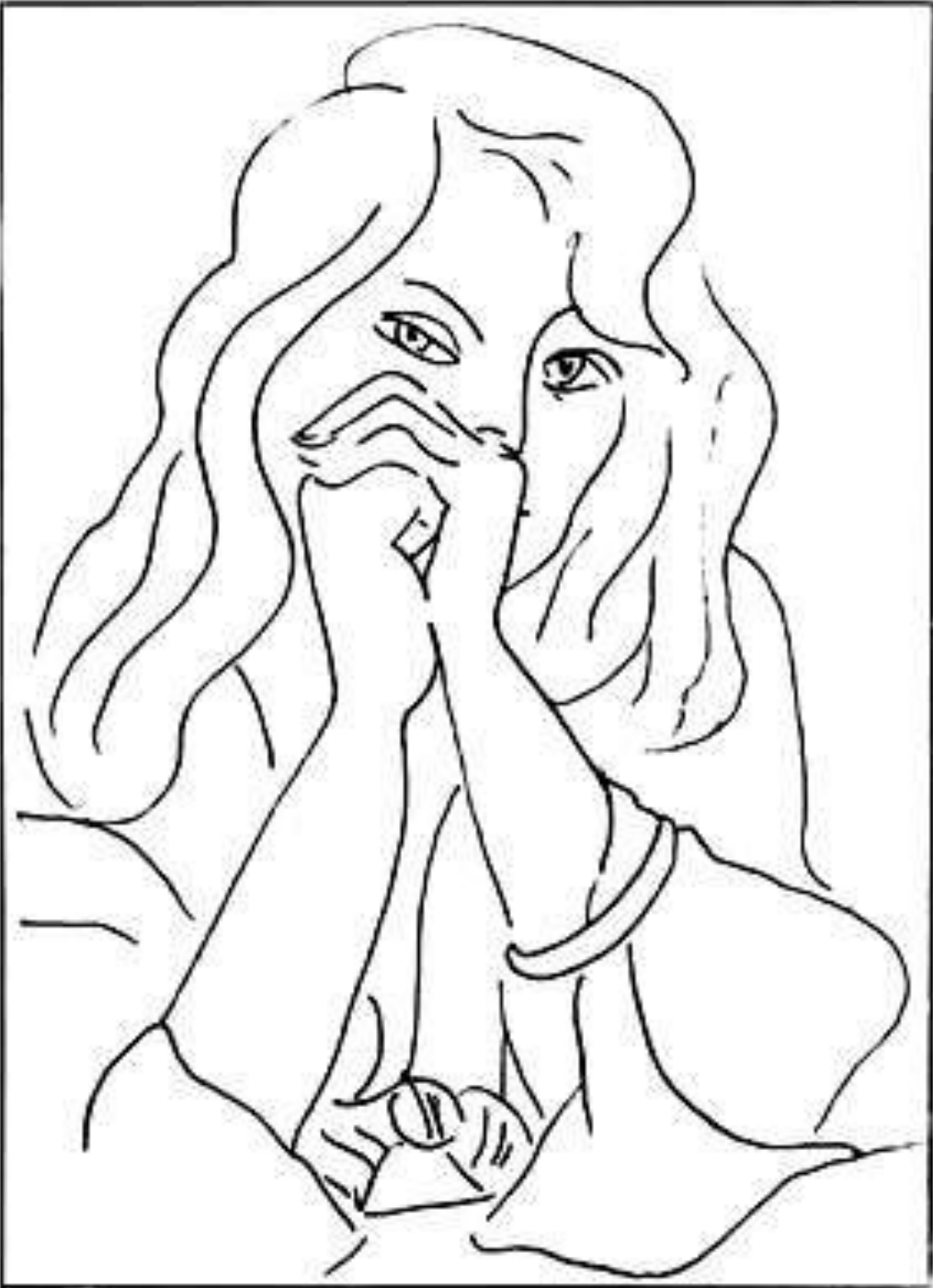
А. Матисс. Женский портрет. Тушь, перо. 1944.