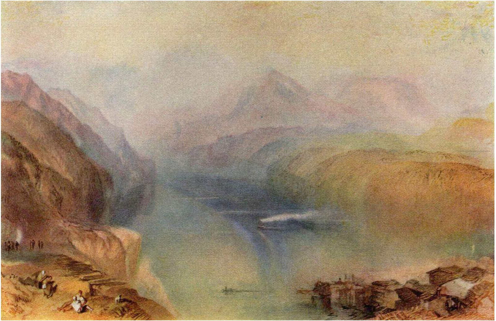
У. Тёрнер. Фирвальдштетское озеро