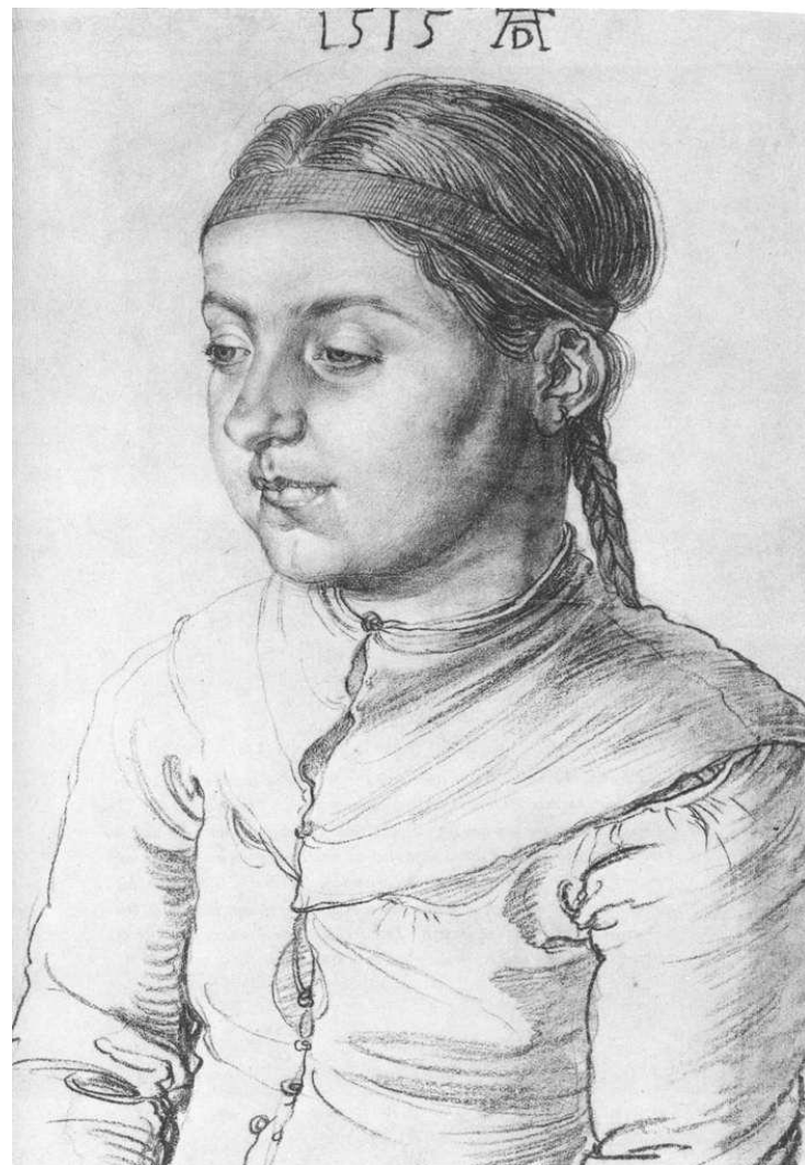
А. Дюрер. Портрет девочки