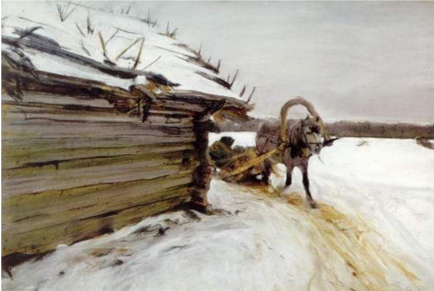
В. Серов. Зимой. 1898 г. Бумага, пастель, гуашь

Гуашь – клеевые водорастворимые непрозрачные краски с примесью белил. После высыхания одного слоя его легко перекрыть другим. Работы, выполненные гуашью, отличаются матовостью и бархатистостью.