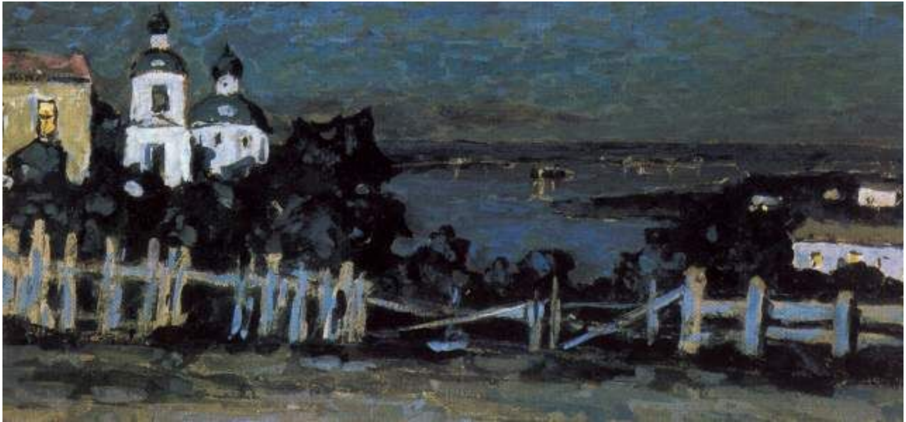
П.И. Петровичев. Ночь. 1910 г. Картон, гуашь.

Техники акварели и гуаши занимают промежуточное положение между графикой и живописью .