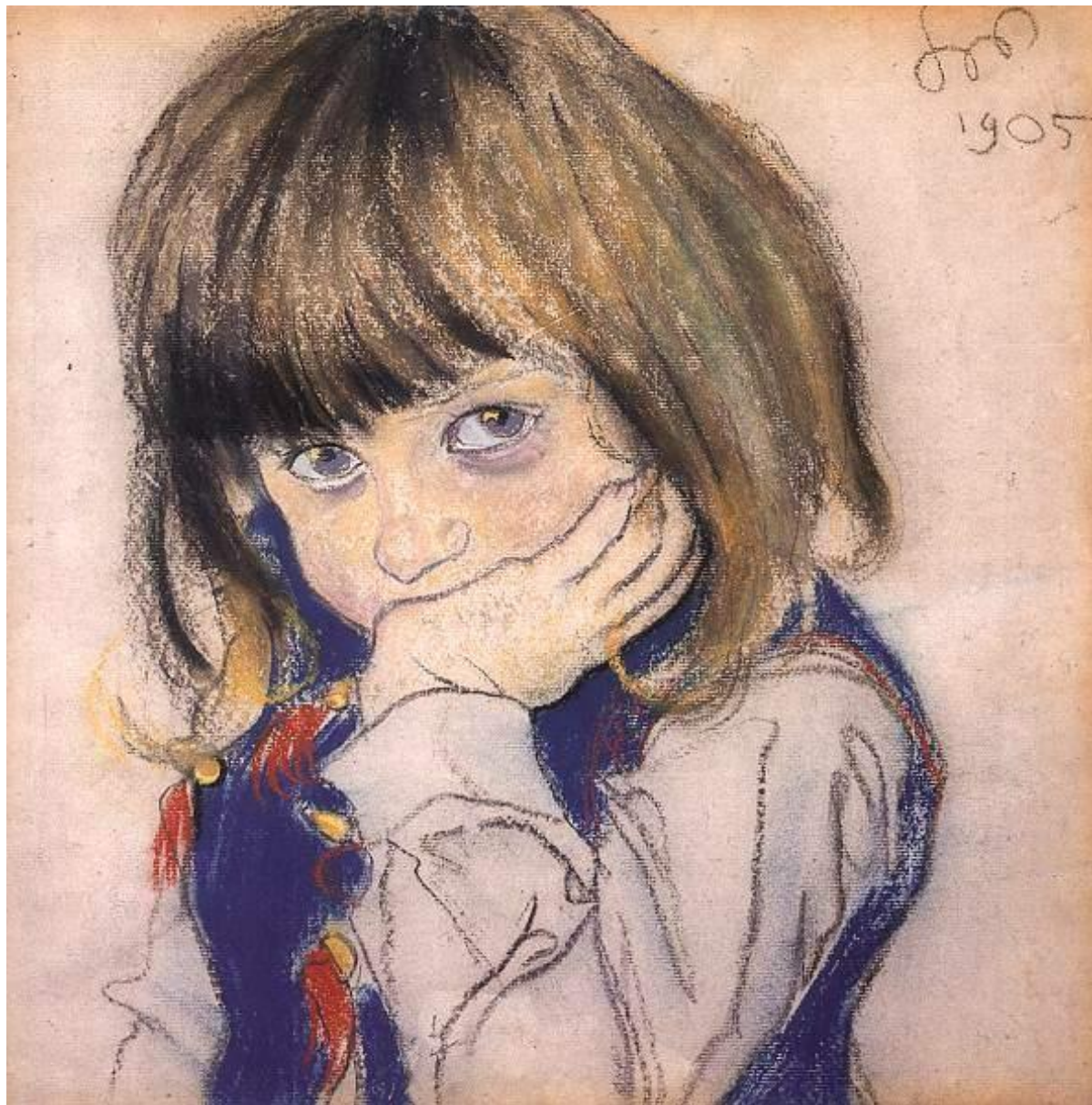
С. Выспаньский. Портрет девочки.

Рисунки, выполненные пастелью, отличаются мягкостью тонов, бархатистой поверхностью.