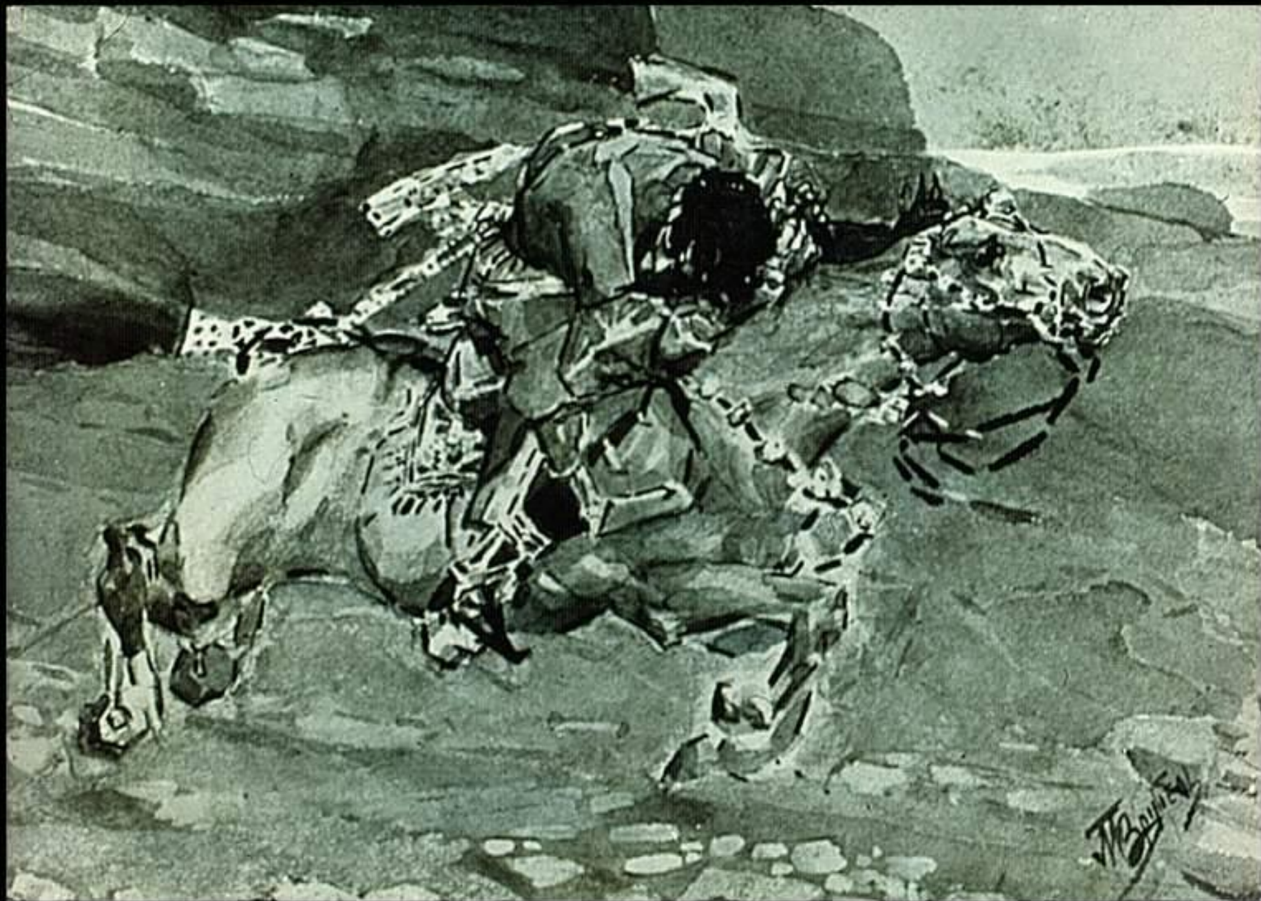
Врубель М.А. иллюстрация к поэме М.Ю. Лермонтова "Демон". 1890-91 бумага, акварель, тушь. ГРМ