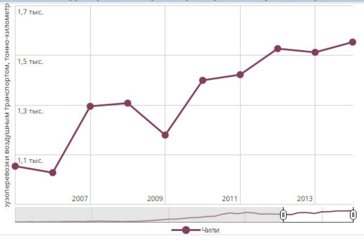
Грузоперевозки воздушным транспортом - Чили (1960 - 2015)