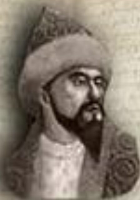
(1598 — 1628) «ЕСКІ ЖОЛЫ» (ДРЕВНИЙ ПУТЬ) ЕСИМ ХАН