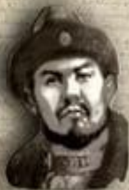
(1445–1518) «ҚАСҚА ЖОЛЫ» (СВЕТЛЫЙ ПУТЬ) КАСЫМ ХАН