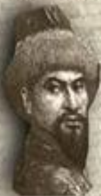
(1626–1718) «ЖЕТІ ЖАРҒЫ» (СЕМЬ ЗАКОНОВ) ТӘУКЕ ХАН