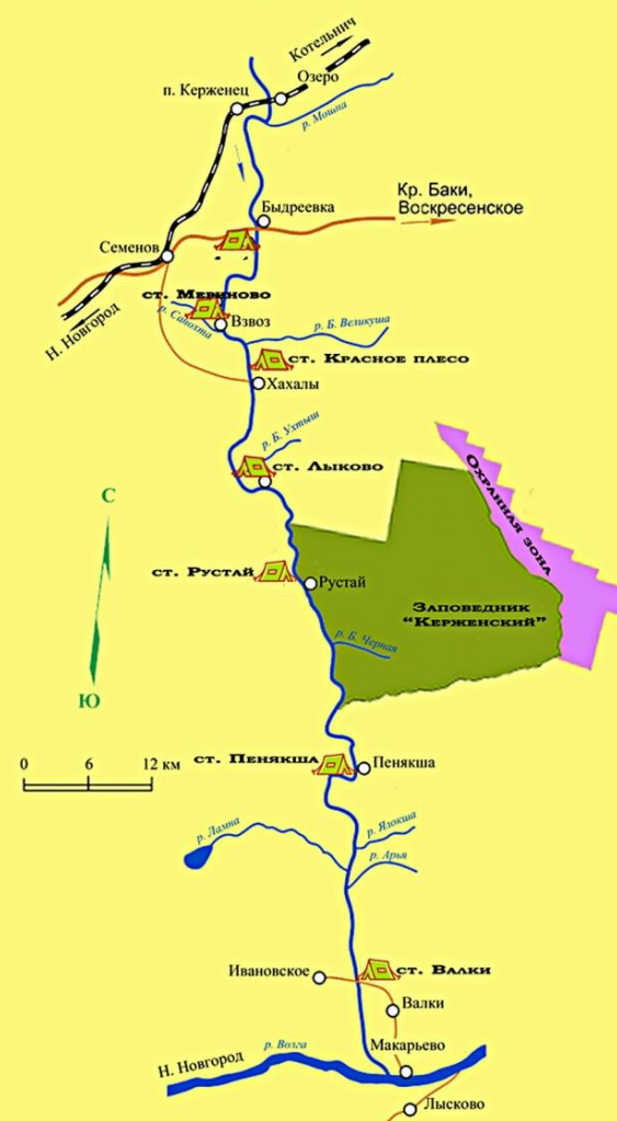
СХЕМА МАРШРУТА ПО Р. КЕРЖЕНЕЦ