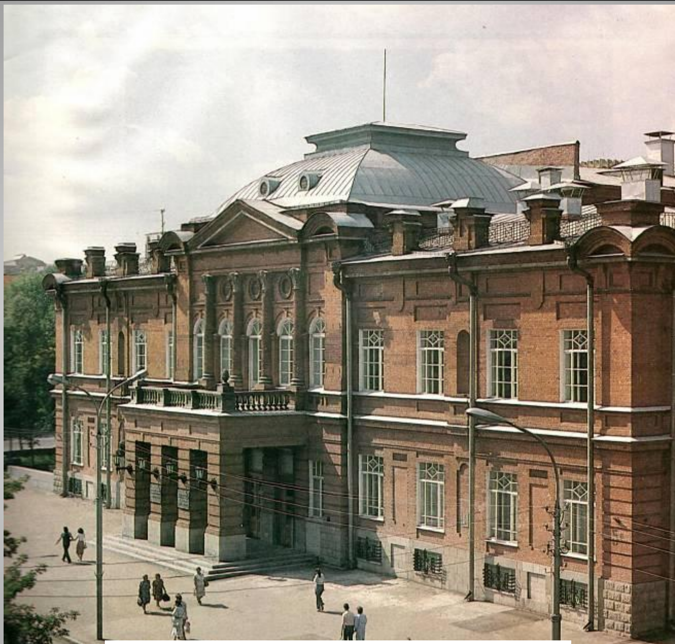
Аксаковский Народный дом в г. Уфе. Фасад по ул. Ленина. Ныне — Башкирский Государственный театр оперы и балета.