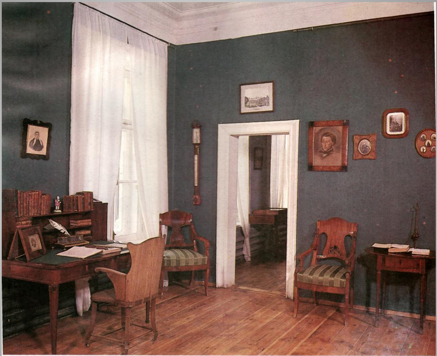
Последние 16 лет своей жизни С. Т. Аксаков прожил в подмосковной усадьбе Абрамцево.