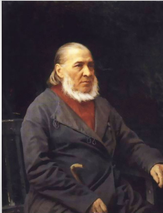
И.Н.Крамской. "Портрет Сергея Тимофеевича Аксакова". 1878 г.