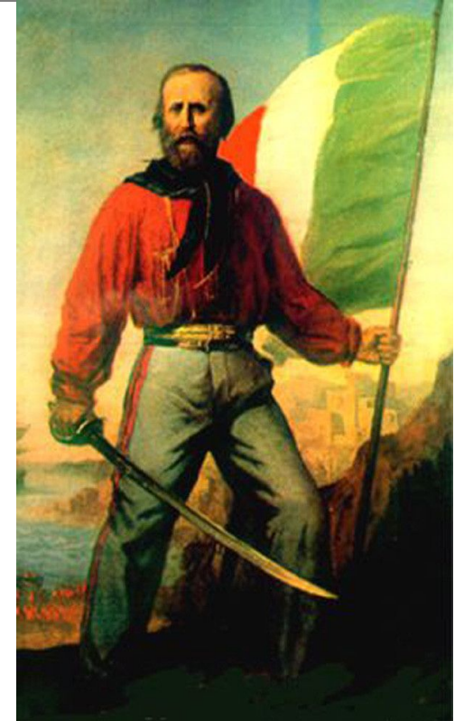
во главе народных масс стоял Джузеппе Гарибальди

Объединение Италии завершилось 20 сентября 1870 г., когда итальянские войска заняли Рим, оккупированный французами.