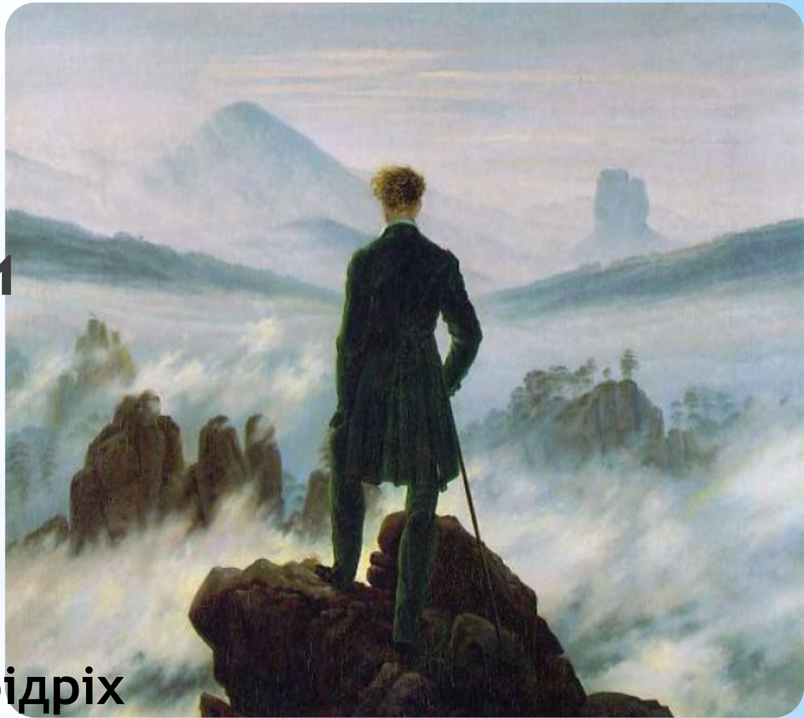
Каспар Давід Фрідріх «Мандрівник над морем туману» 1818