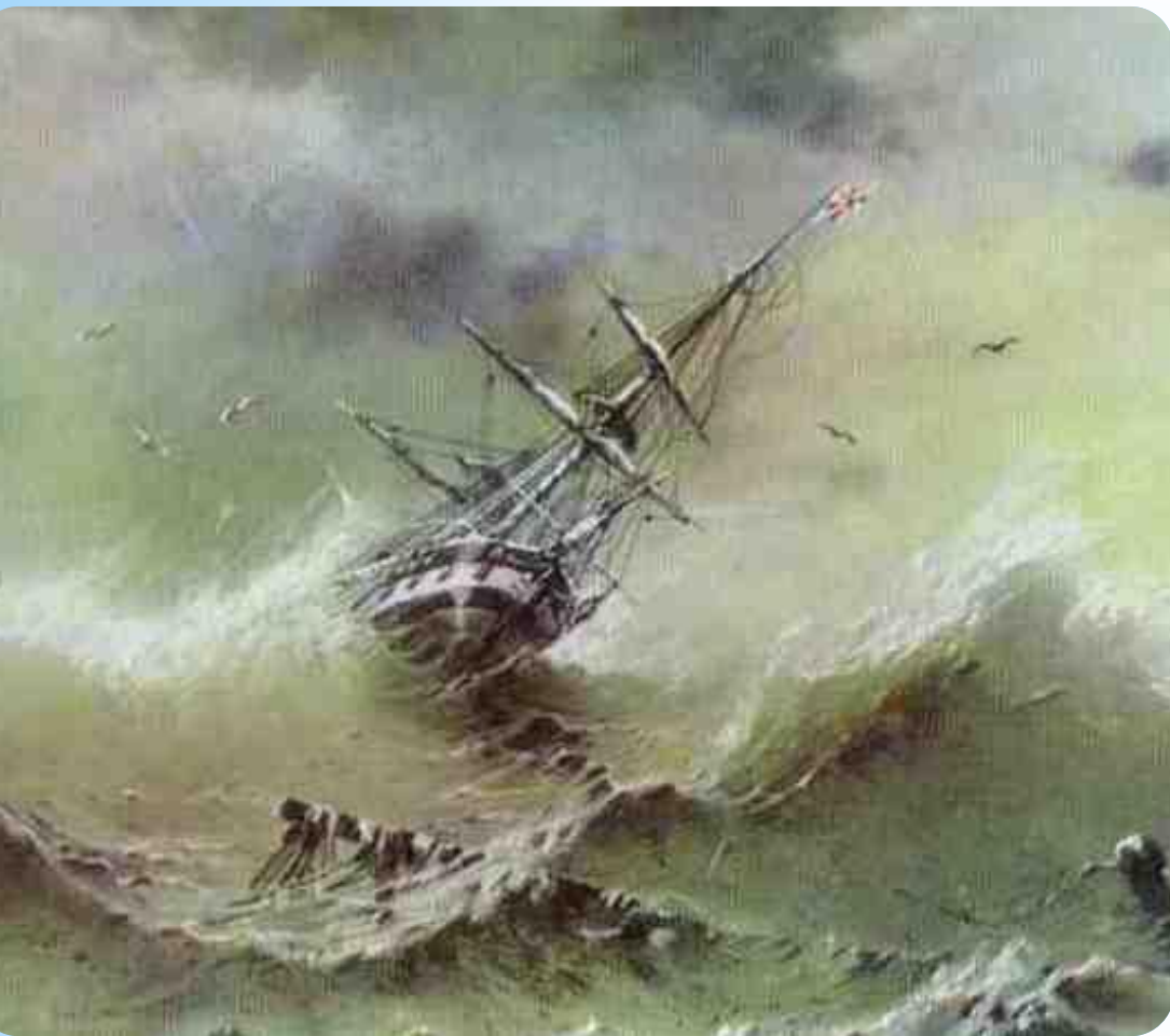
І.К.Айвазовський “Шторм” 1854 р.