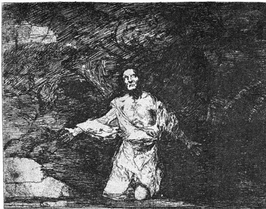
Tristes presentimientos de lo que ha de acontecer.