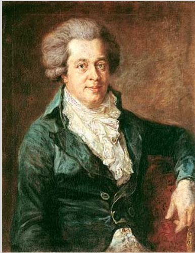
Отец Леопольд Моцарт