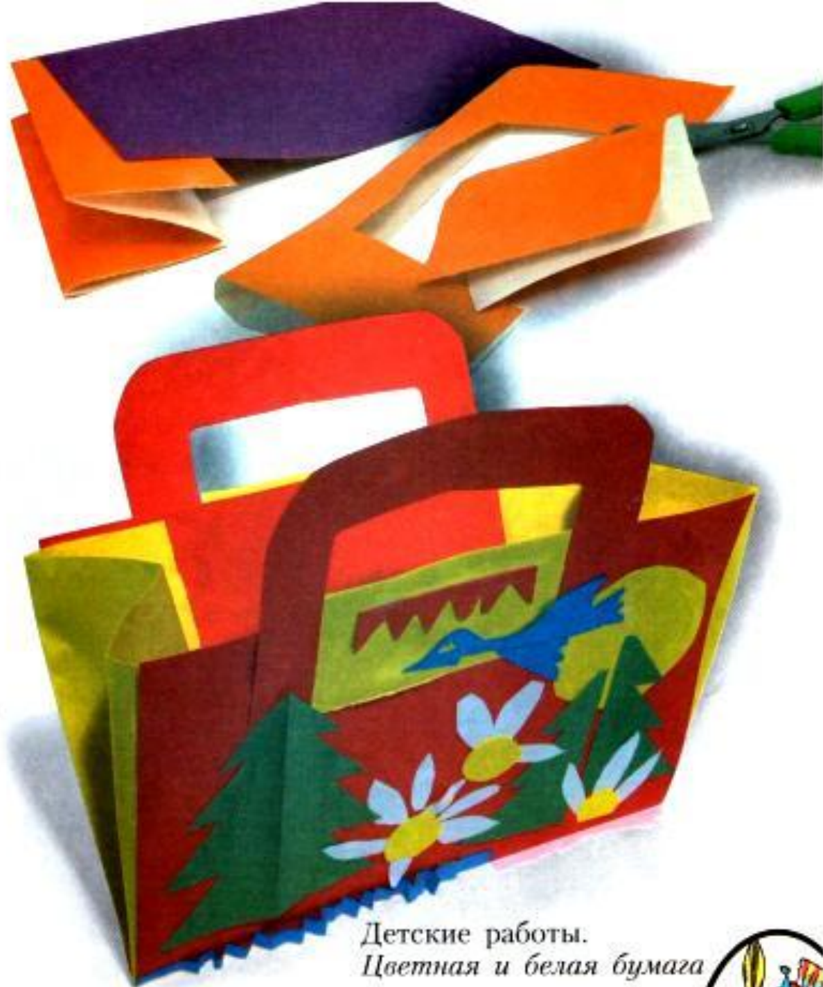
Детские работы. Цветная и белая бумага