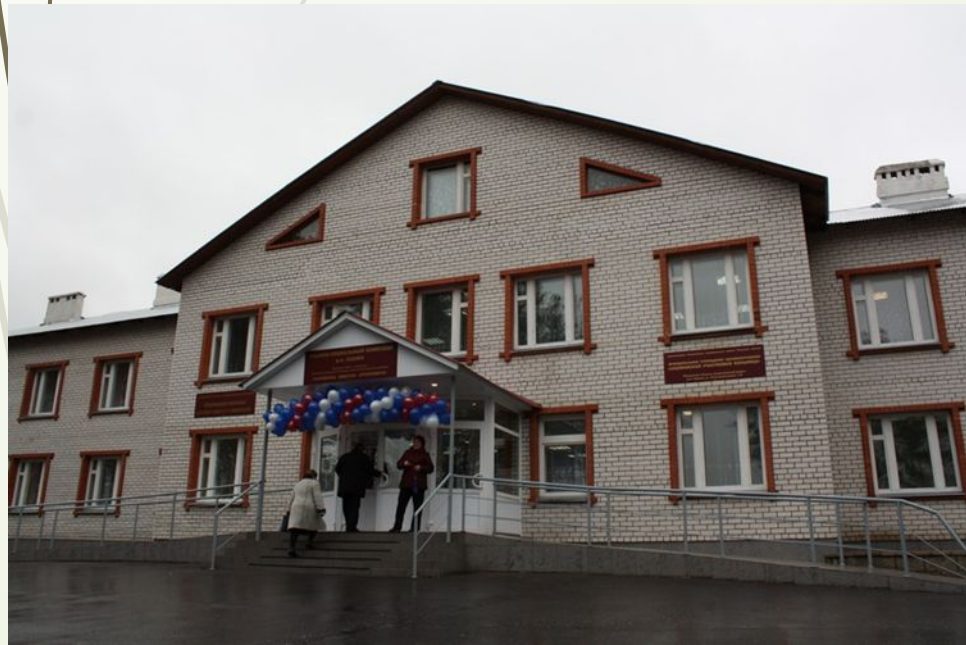
Лашманская участковая больница.

В доме-интернате проживают 47 человек. Расположен он в красивом сосновом лесу, с большой территорией. Здесь разбиты клумбы, установлены беседки, скамейки и качели для прогулок проживающих.