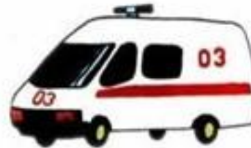
При тошноте, рвоте, повышении температуры вызвать врача