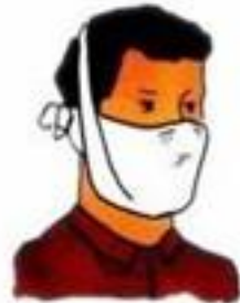
При отсутствии респиратора надеть ватно-марлевую повязку