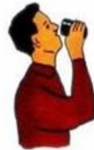
Дать таблетку йодистого калия Взрослым и детям старше 2 лет — по 1 таблетке (0,125 г), детям до 2 лет — по 1 таблетке (0,05 г)