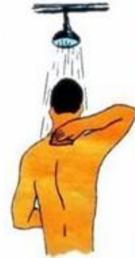
Обмыть пострадавшего, сменить одежду и обувь