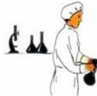
Пить воду и употреблять пищу — только после лабораторного контроля!