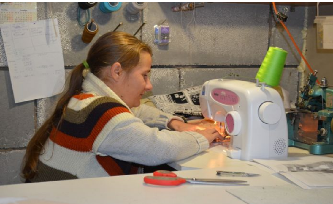
Направления социального контракта в 2020 году