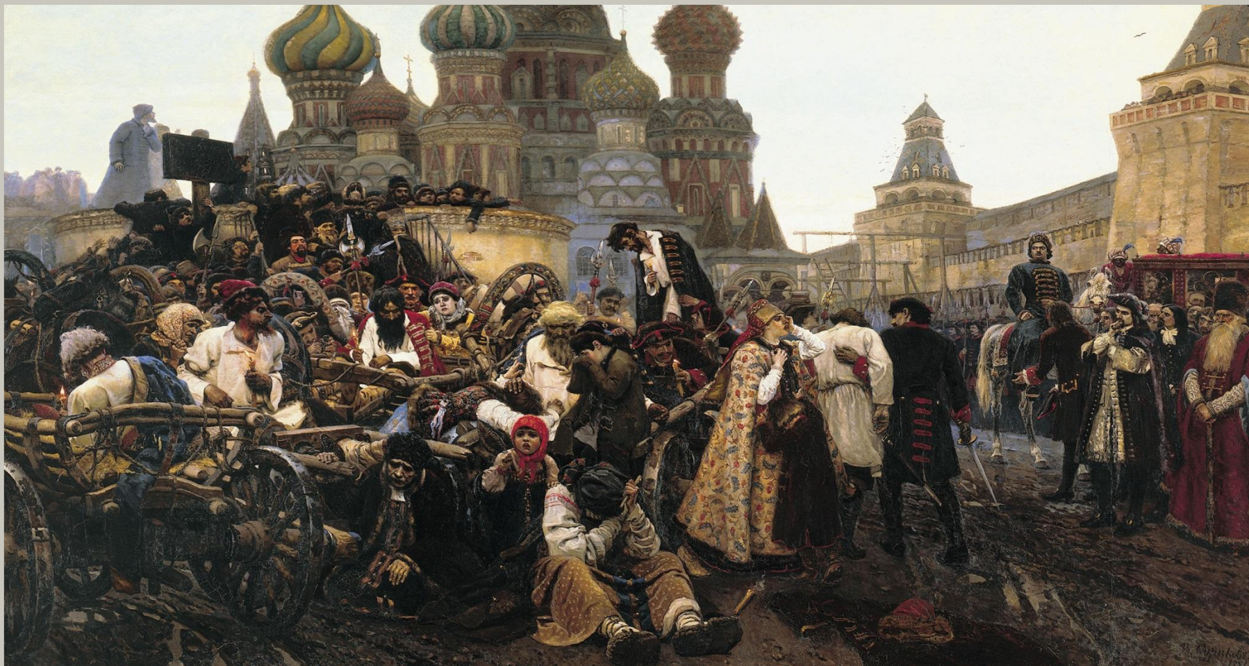
"Утро стрелецкой казни"

Переезд молодого художника в Москву, впечатления от старинной архитектуры «первопрестольной» сыграли важную роль в формировании его первого шедевра в серии картин на историческую тему "Утро стрелецкой казни", завершено в 1881 году.