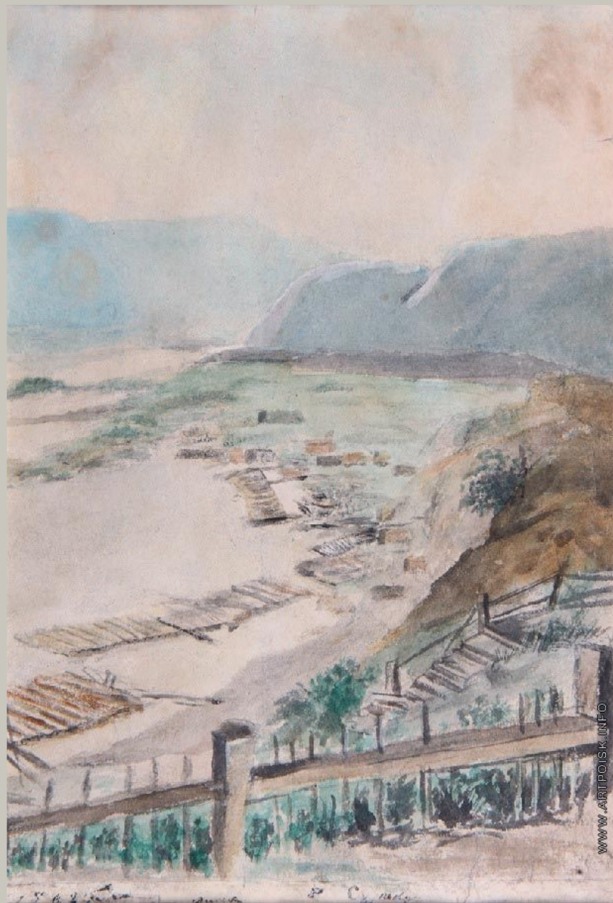
«Плоты на Енисее»