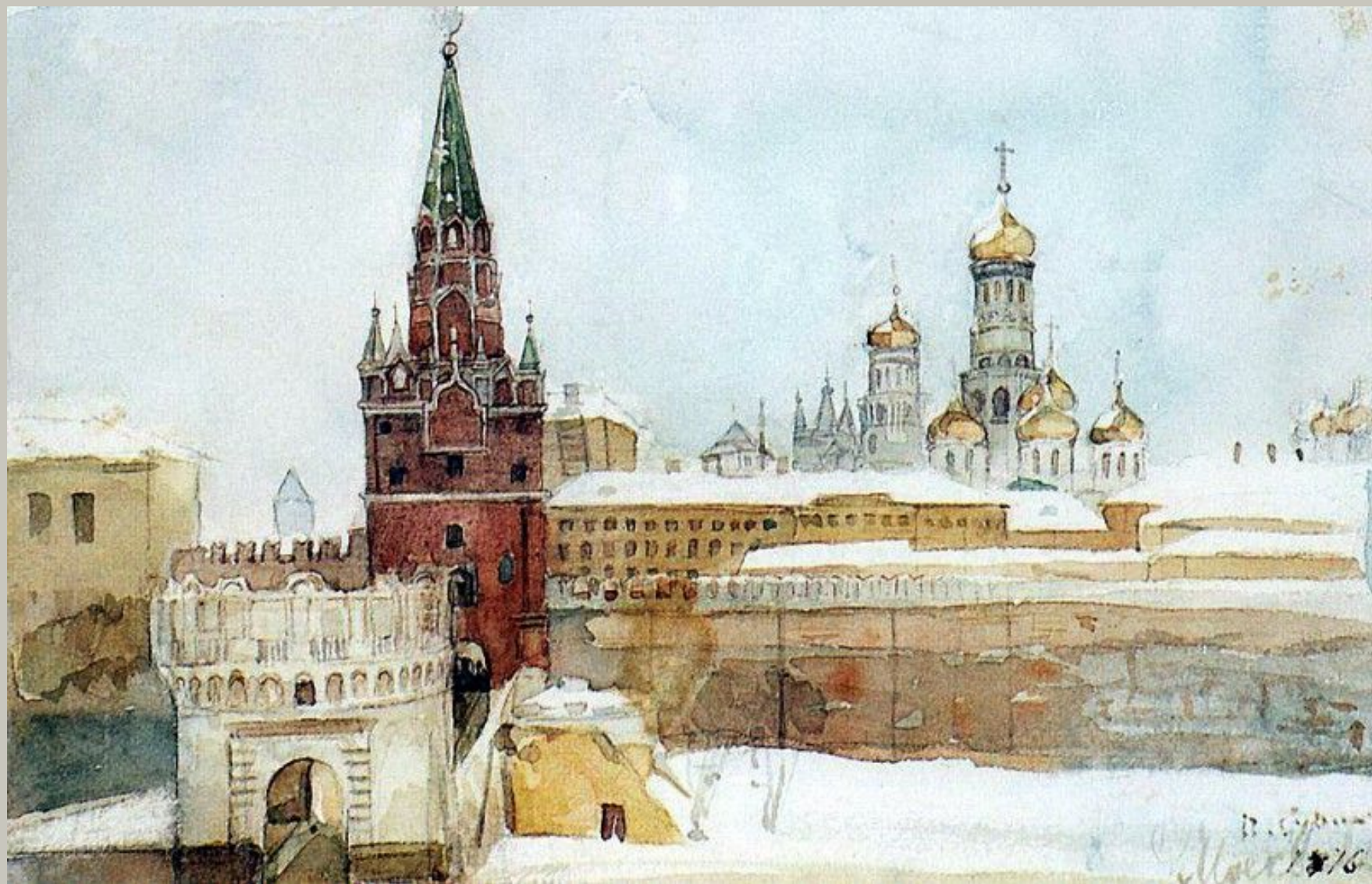
«Вид на Кремль»