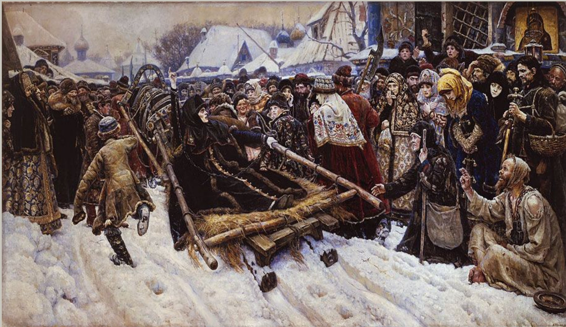
«Боярыня Феодосия Морозова»