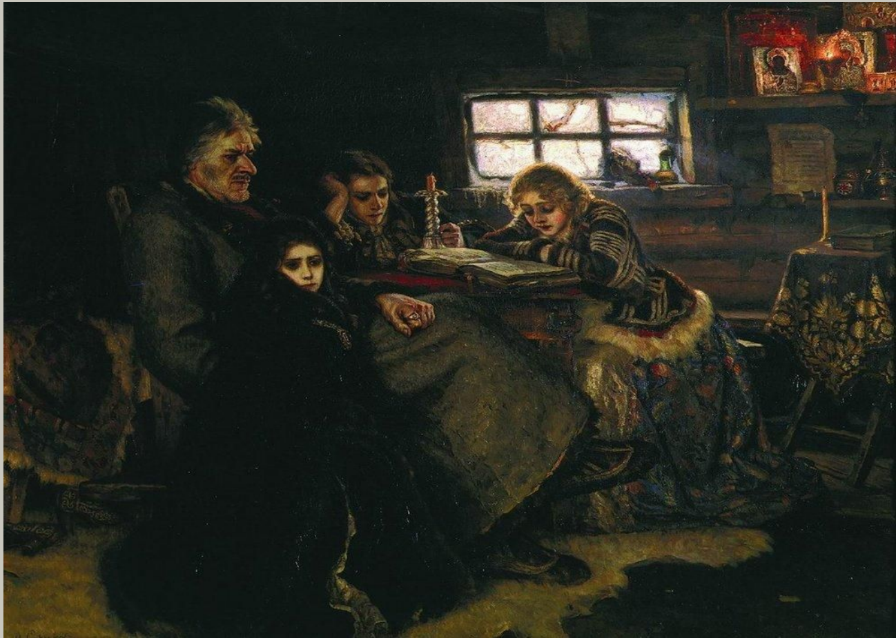
«Меншиков в Березове»

Свой дар выдающегося живописца-историка Суриков подтвердил в полотнах "Меншиков в Березове" и "Боярыня Феодосия Морозова", тоже своего рода сложных и в то же время впечатляюще-целостных визуальных.