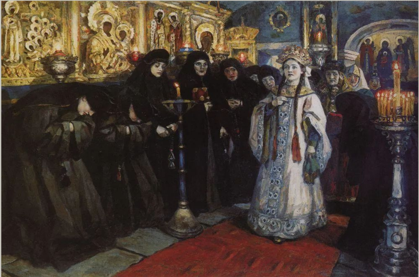
"Посещение царевны женского монастыря"

Стремясь добиться максимальной убедительности образного действия, в поздних вещах Суриков уменьшает число фигур, параллельно усиливая выразительность красочной фактуры "Посещение царевны женского монастыря"; "Благовещение".