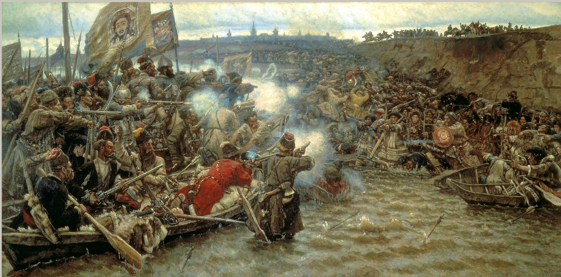
«Покорение Сибири Ермаком»

Последующие полотна: "Покорение Сибири Ермаком"; "Переход Суворова через Альпы"; "Степан Разин " - уже представляют определенного рода спад. Они написаны виртуозно, но уже без того сложного драматизма, который отличает лучшие произведения мастера.