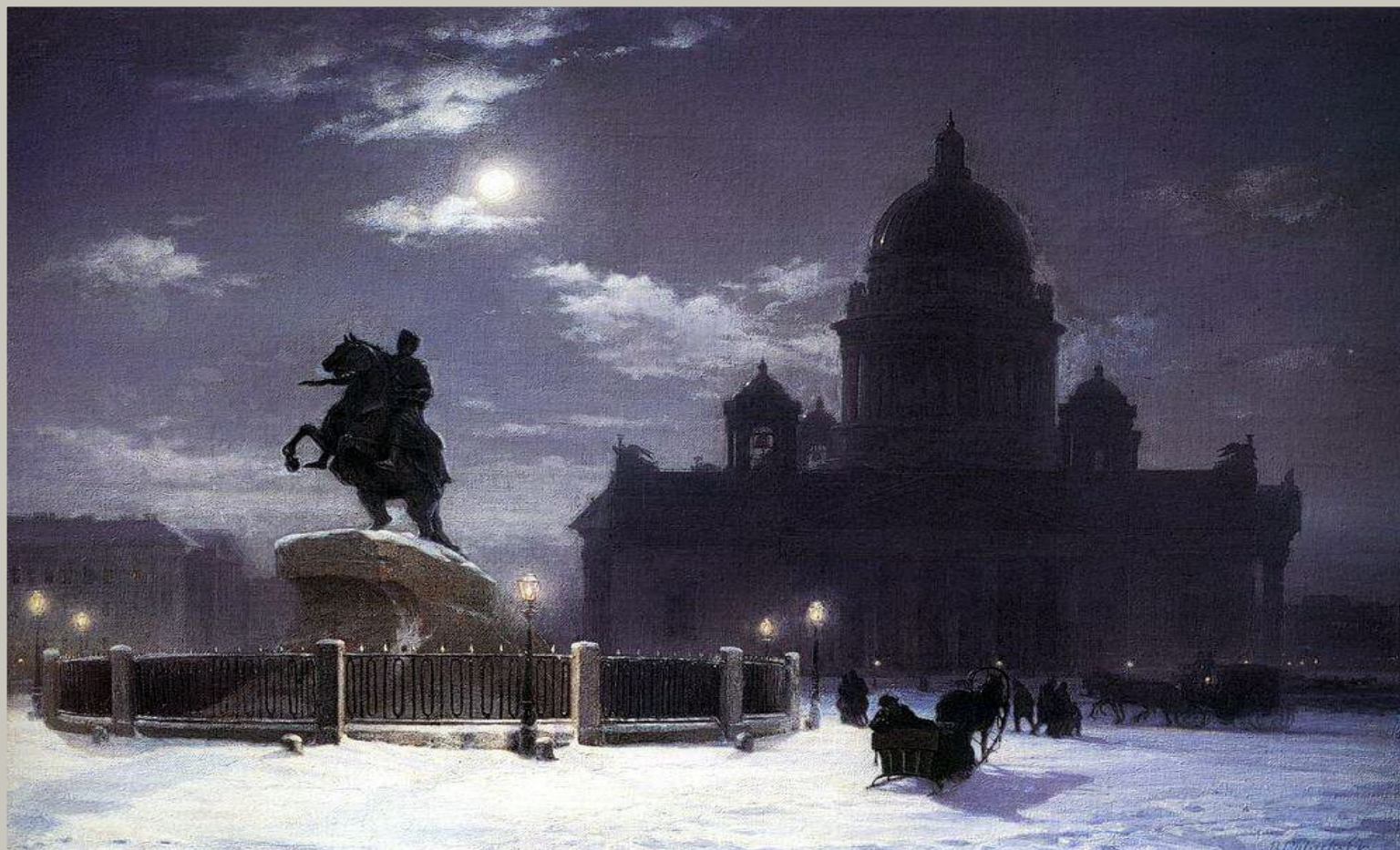
"Вид памятника Петру I в Петербурге"

Уже в студенческие годы проявил себя как мастер историко-ассоциативных образов - "Вид памятника Петру I в Петербурге". В 1876–1877 годах создал эскизы на тему четырех вселенских соборов для украшения храма Христа Спасителя.