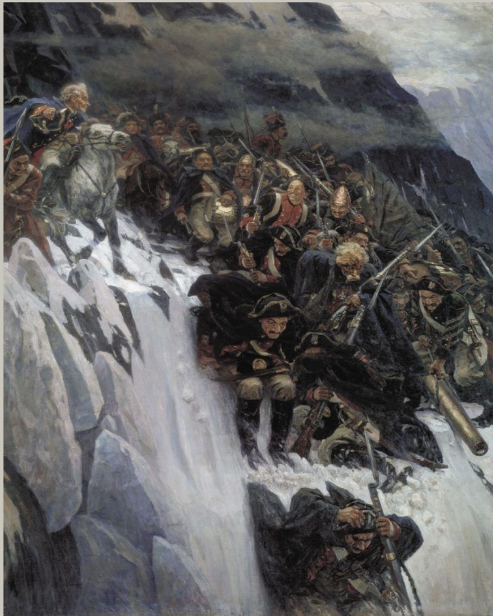
"Переход Суворова через Альпы"