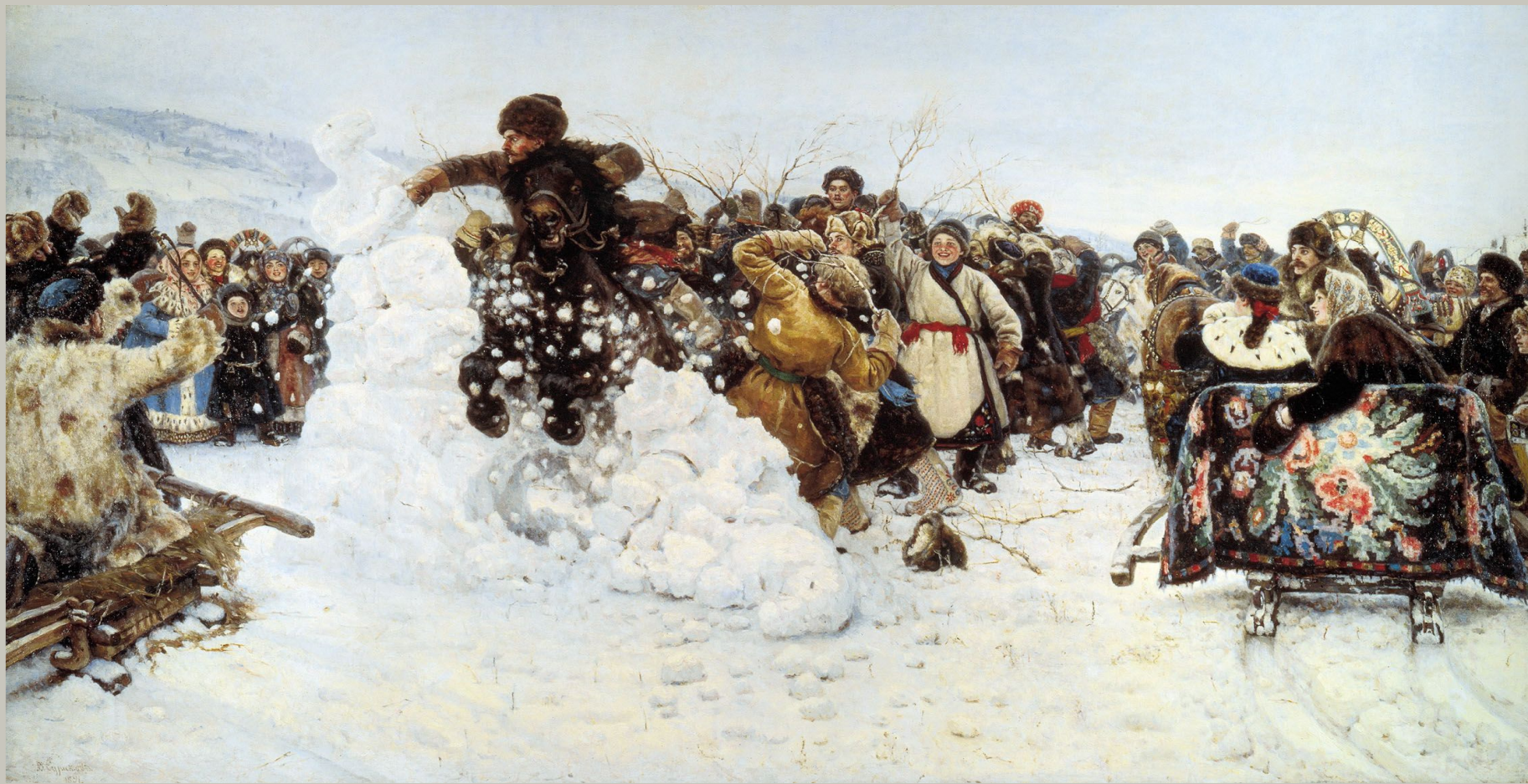
«Взятие снежного городка»

Красочная выразительность деталей сочетается с виртуозностью общей режиссуры. Всем этим трем картинам живописца не уступает и полотно Сурикова "Взятие снежного