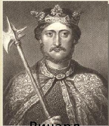
Ричард Львиное Сердце

Английский народ переживает тяжёлые времена. Король Ричард Львиное Сердце не вернулся из последнего крестового похода, взятый в плен коварным герцогом Австрийским. Место его заключения неизвестно. Между тем брат короля, принц Джон, вербует себе сторонников, намереваясь в случае смерти Ричарда отстранить от власти законного наследника и захватить престол.