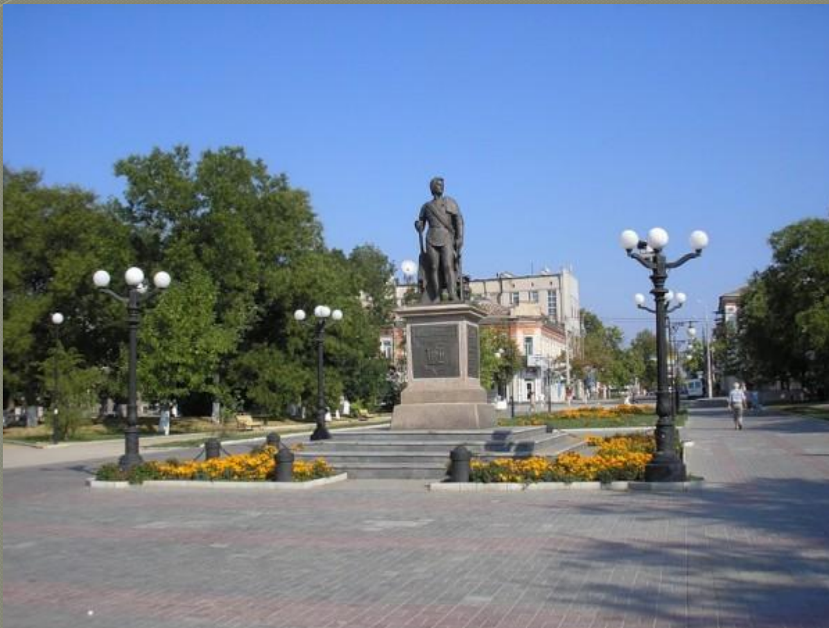
Памятник в Херсоне