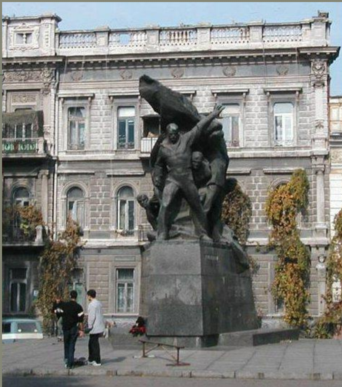
Памятник в Одессе