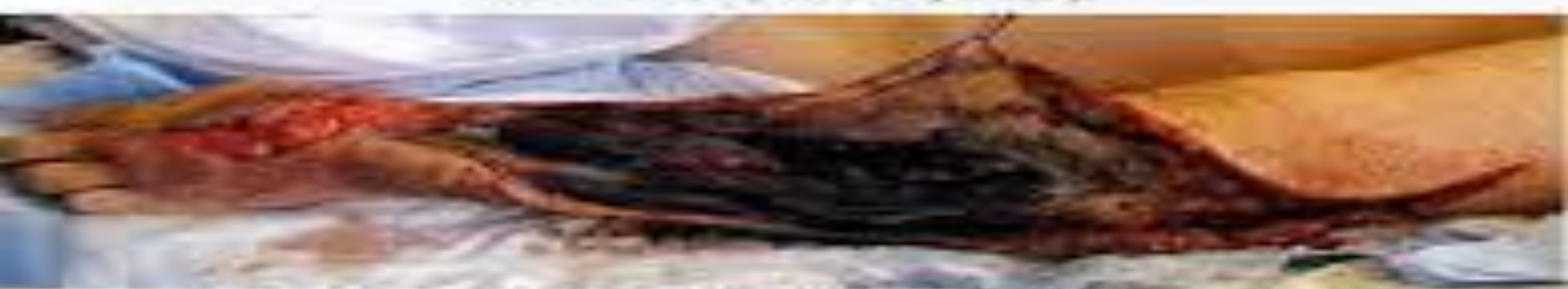
Рис. 4. Тот же больной вид с другой стороны. В дельтовидной мышце видна контура ампутированного