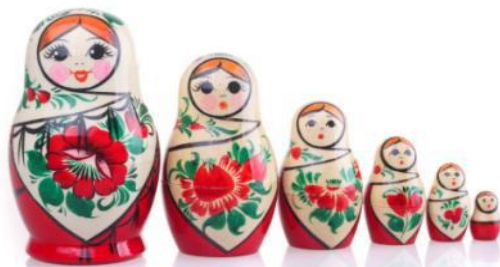
Вятская, г. Вятка