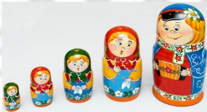
Загорская (Сергиево-Посадская), г. Сергиев Посад (бывш. Загорск)