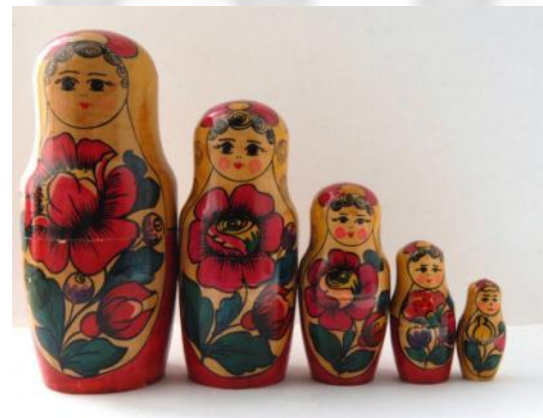
Полхов-Майданская, г. Полхов-Майдан, Нижегородская обл.