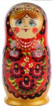
Тверская, г. Тверь