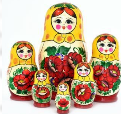
Семёновская, г. Семёнов Нижегородская обл.