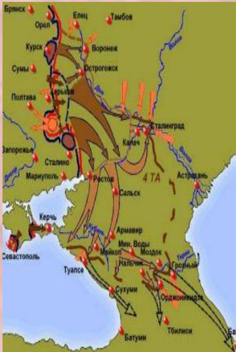
Немецкое наступление летом 1942 г.

Весной 1942 г. перевес по-прежнему был у немцев. Они начали наступление в Крыму, смогли овладеть Севастополем и Керченским проливом. В мае по инициативе маршала С.Тимошенко советские войска начали наступление под Харьковом и даже смогли освободить город. Но немцы перешли в контрнаступление и окружив ряд армий уничтожили 230тыс. советских солдат. Стратегическая инициатива возвратилась к Германии и в конце июня немцы устремились на юго-восток.