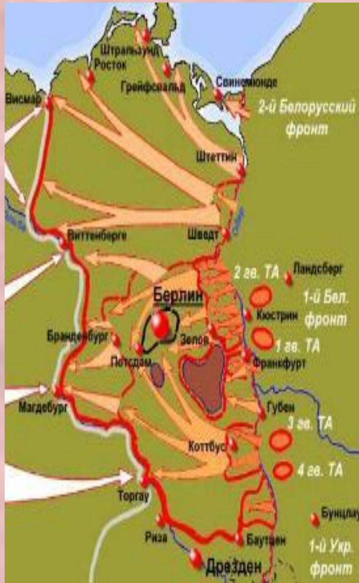
Битва за Берлин

24 апреля кольцо вокруг Берлина сомкнулось. Гитлер решил снять войска с Западного фронта. В результате этого американцы стремительно двинулись вперед и 25 апреля на Эльбе встретились с армией маршала И.Конева. 30 апреля на Рейхстагом взвилось Красное Знамя. 2 мая Берлин пал. 8 мая в присутствии Г.Жукова фельдмаршал Кейтель подписал капитуляцию. 9 мая капитулировала группировка в Праге. Этот день стал Днем Победы.