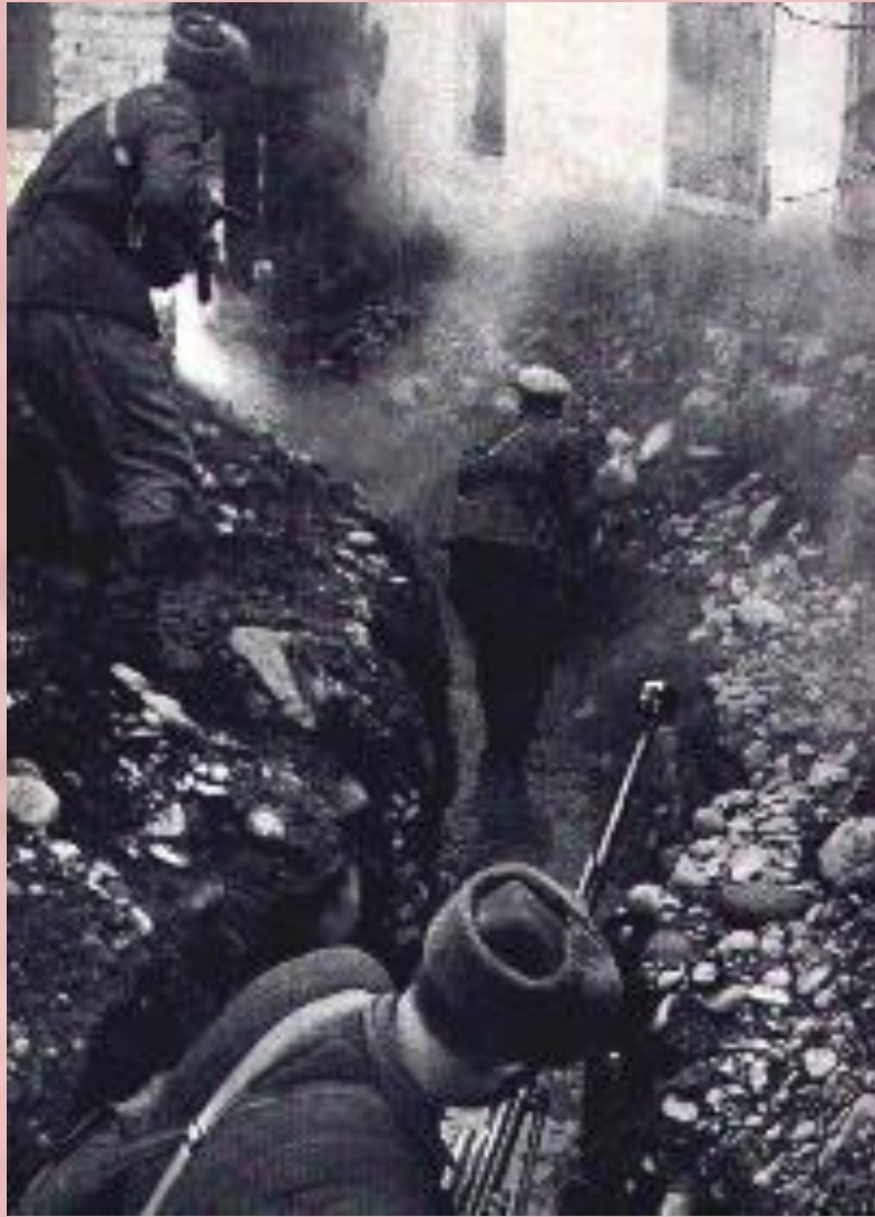
Бой за Моздок. Сентябрь 1942 г.

Начиная войну Гитлер рассчитывал, что СССР развалится как «карточный домик», но советский народ наоборот только сплотился.