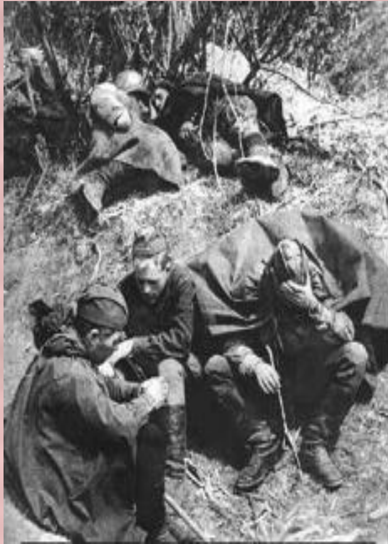
Воронежский фронт. Между боями.

Они вышли к Дону и 24 июля заняли Ростов-на-Дону. И.Сталин подписывает приказ №227 («Ни шагу назад!»). В начале сентября немцы подошли к Сталинграду и на окраинах города завязались уличные бои. Врагу удалось выйти к Волге, но постепенно их наступательный потенциал иссяк и немцы сами перешли к обороне.