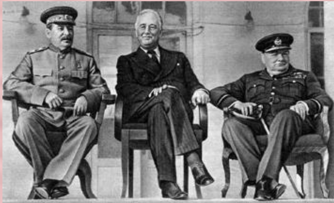
И.Сталин, Ф.Рузвельт, У.Черчилль в Тегеране.

В ноябре 1943 г. в Тегеране состоялась встреча И. Сталина, Ф.Рузвельта и У.Черчилля. На ней была достигнута договоренность об открытии в мае 1944г. второго фронта в Европе. СССР дал согласие после разгрома Германии вступить в войну против Японии. Стороны выработали принципы создания Организации Объединенных Наций. Эти решения предопределили поражение фашистского блока.