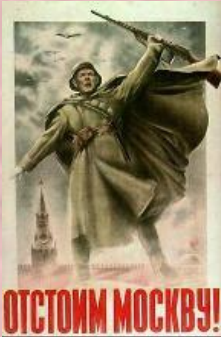
Плакат 1941 г.

Для захвата Москвы был подготовлен план «Тайфун».