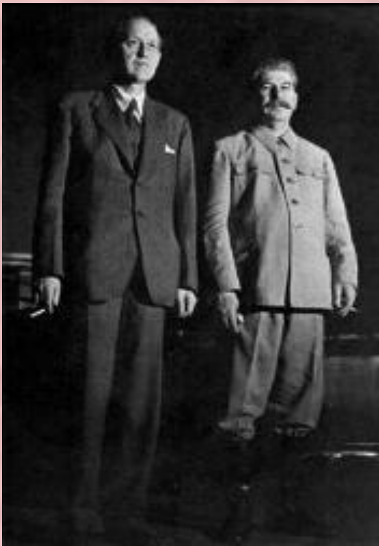
Сталин и Г.Хопкинс на переговорах по ленд-лизу

Летом 1941 г. Англия и США заявили о своей поддержке Советского Союза. В июле 1941 г. СССР и Великобритания подписали соглашение о совместных действиях, а в августе США объявили об оказании нашей стране экономической и военно-технической помощи. 1 января 1942 г. была образована антигитлеровская коалиция из 26 государств.