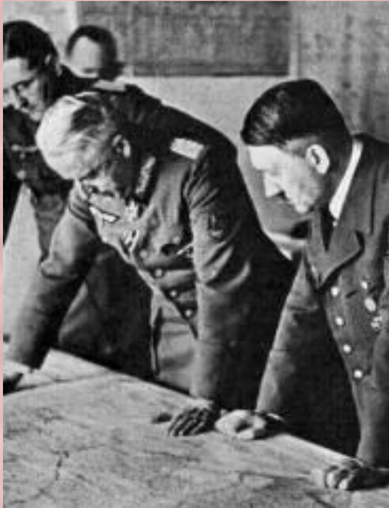
А.Гитлер и Э.Манштейн у карты.

Победа под Москвой породила у И.Сталина иллюзию о быстром разгроме немецких войск и он поставил задачу уже в 1942г. начать общее наступление. Сталин предполагал, что немцы весной –летом 1942 г. вновь начнут атаковать Москву. Германия в это время испытывала недостаток сырья и Гитлер решил наступать на Юге, а для дезинформации Сталина немцы провели операцию «Кремль».