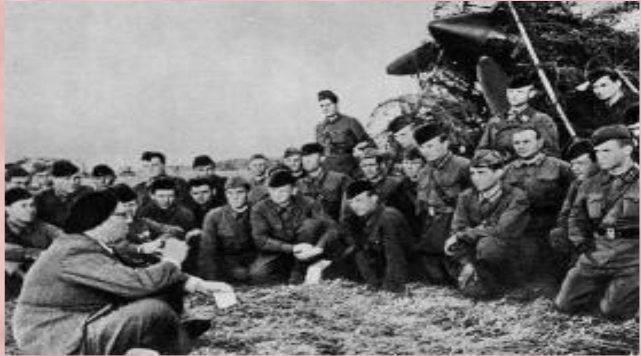
А.Н.Толстой у летчиков

Другие представители культуры выезжали на фронт в составе артистических бригад. В Средней Азии на объединенной киностудии продолжали снимать кинофильмы. Огромную популярность приобрели лирические песни. Д.Шостакович в осажденном Ленинграде написал Седьмую симфонию. В Москве и Ленинграде продолжали работать театры.