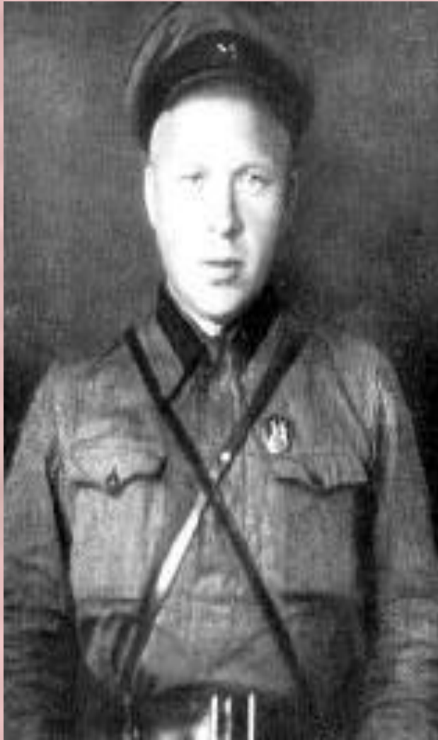
А.П.Гайдар на фронте

С первых дней войны тысячи деятелей советской культуры ушли на фронт. Защищая Родину погибли А.Гайдар и Е. Петров. Фронтowymi корреспондентами работали М.Шолохов, К.Симонов, А. Фадеев. В осажденном Ленинграде продолжали работать О. Бергольц, Д. Шостакович. События тех дней нашли отражение во «Фронтowych дневниках» К. Симонова.