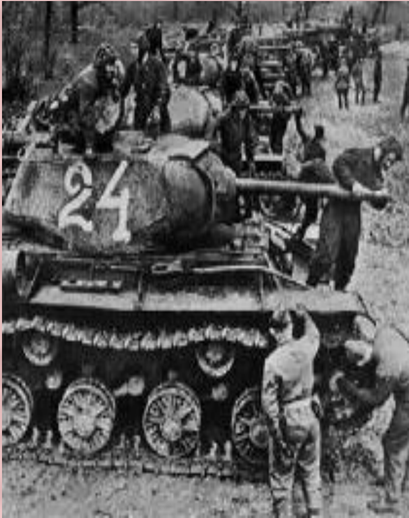
Советские танки перед Курской битвой

12 июля советские войска перешли в наступление. Под д.Прохоровка разгорелось крупнейшее в истории танковое сражение(1200 машин). Этот день стал переломным в ходе битвы. В течение месяца были освобождены Харьков, Орел, Белгород. Германия потеряла 500 тыс. солдат, 1500 танков, 3700 самолетов. В сентябре 1943 г. началась битва за Днепр, 6 ноября 1943 Красная Армия освободила Киев.