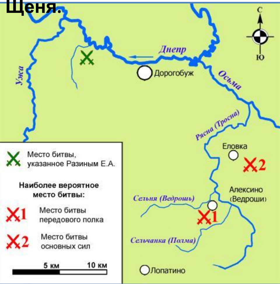
Схема месторасположения поля Ведрошской битвы (14 июля 1500 г.). Русскими войсками командовал Дмитрий Щеня.