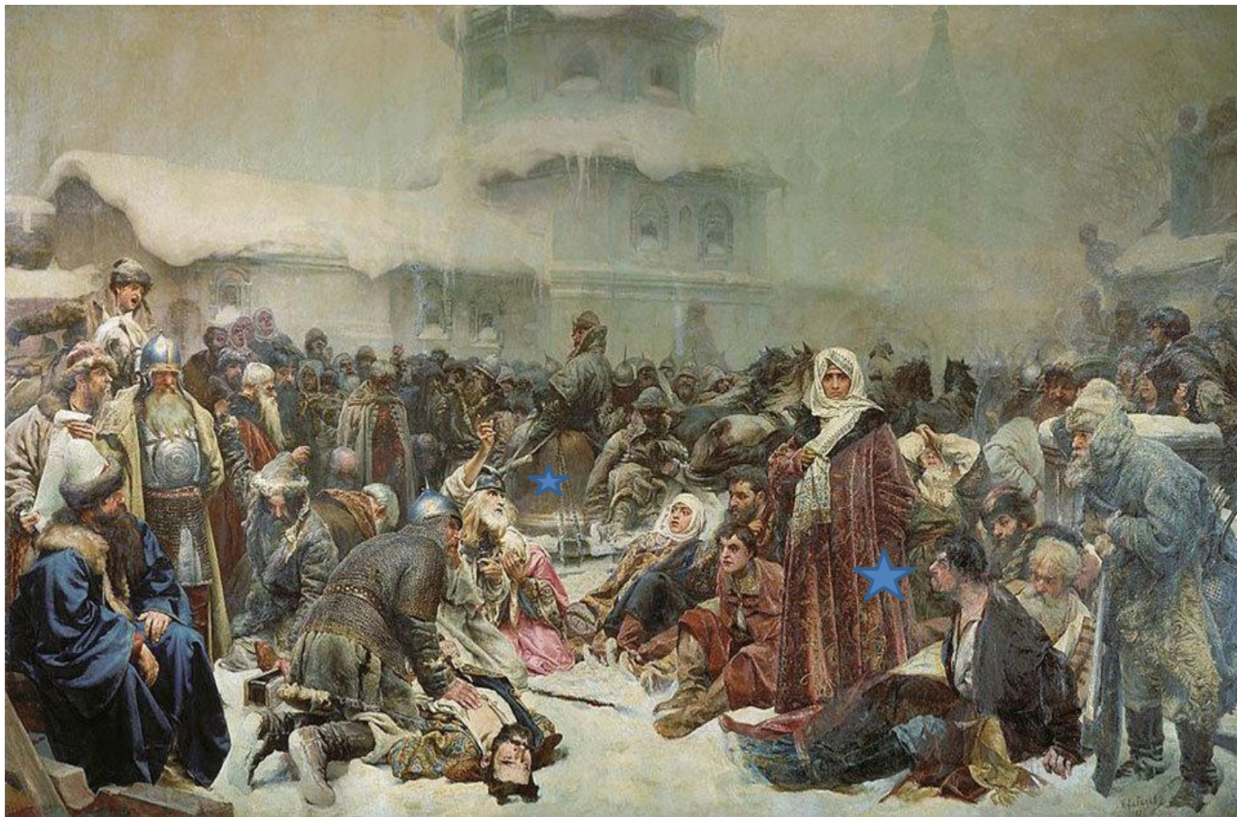
Клавдий Лебедев, «Марфа Посадница. Уничтожение новгородского веча», 1889 год