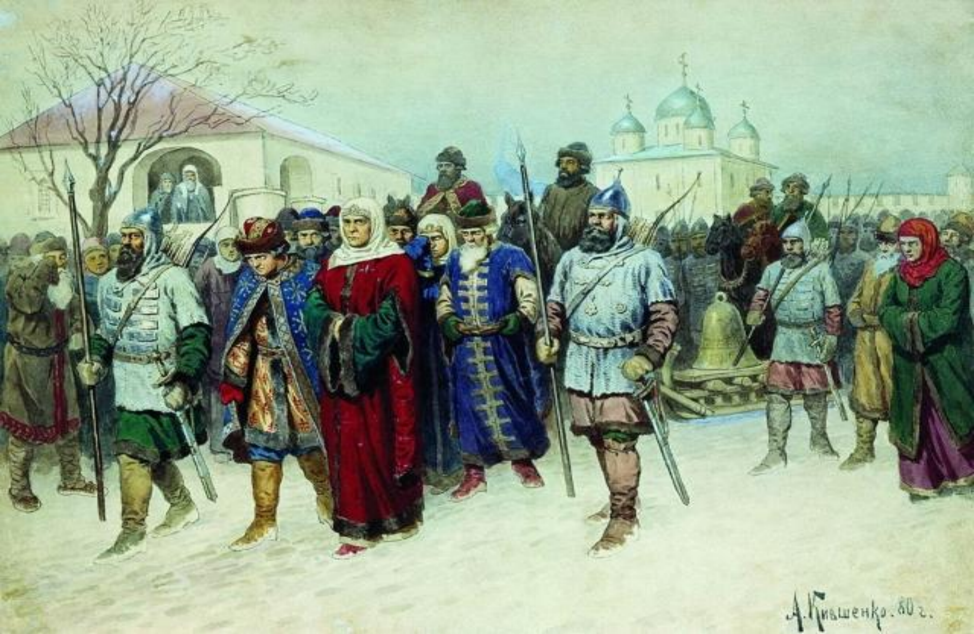
«Отправка Марфы Борецкой новгородского вечего колокола в Москву в 1478 году». Кившенко А. Д.