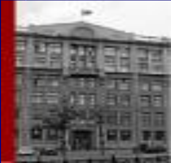
Администрация Президента Москва, Старая площадь, 4