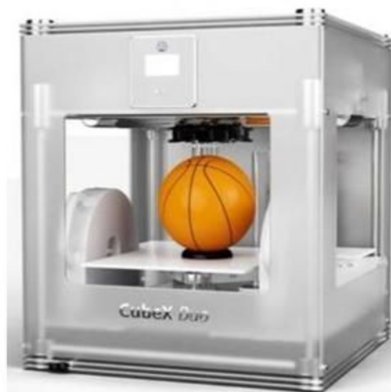
3D принтер Cubex Duo