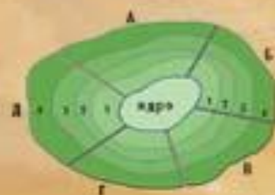
РАЙОНИРОВАНИЕ "СНИЗУ" (УЗЛОВОЕ)