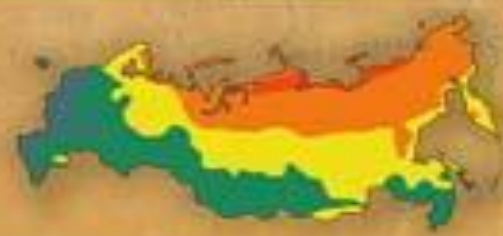
СТЕПЕНЬ БЛАГОПРИ- ЯТНОСТИ ПРИРОДНЫХ УСЛОВИЙ ЖИЗНИ НАСЕЛЕНИЯ