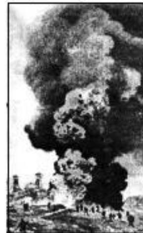
Пожежа на свердловині «Ойл Сіті», м. Борислав, 1908 р.

1908р. вироблено холендарський нафтовий синдикат.Цього року побудовано сверловину "Оіл Сіті". Того ж року спалахнула пожежа.