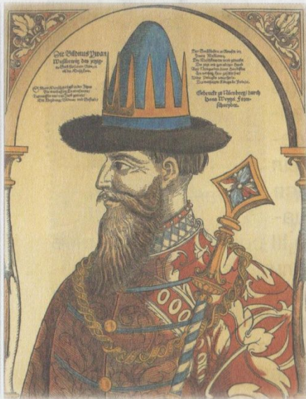
Царь Иван IV Грозный

Первый царь всея Руси Иван IV Васильевич Грозный (1533–1584) вступил на престол в 3-летнем возрасте. Первое время государством управляла его мать, Елена Глинская, пока её не отравили бояре. Затем в стране началось боярское правление (1538–1546), отмеченное интригами и смутой. В январе 1547 г. митрополит Макарий венчал Ивана IV на царство шапкой Мономаха. Наделённый от природы блестящими дарованиями, царь был незаурядной личностью: современников изумляли его начитанность, прекрасная память, ораторский дар. Любитель книг и редких минералов, Иван Васильевич сочинял церковные песнопения и занимался литературным творчеством. Вместе с тем он был подозрительным и жестоким, злобным и мстительным. Считая себя самодержцем «Божией милостью», в подданных он видел рабов, которых был волен жаловать или казнить. За это царя впоследствии и прозвали Грозным. Он стремился сделать власть неограниченной и жестоко подавлял любое сопротивление своей воле. После проведения ряда важных для государства реформ он ввёл в стране кровавый режим опричнины (1565–1572).