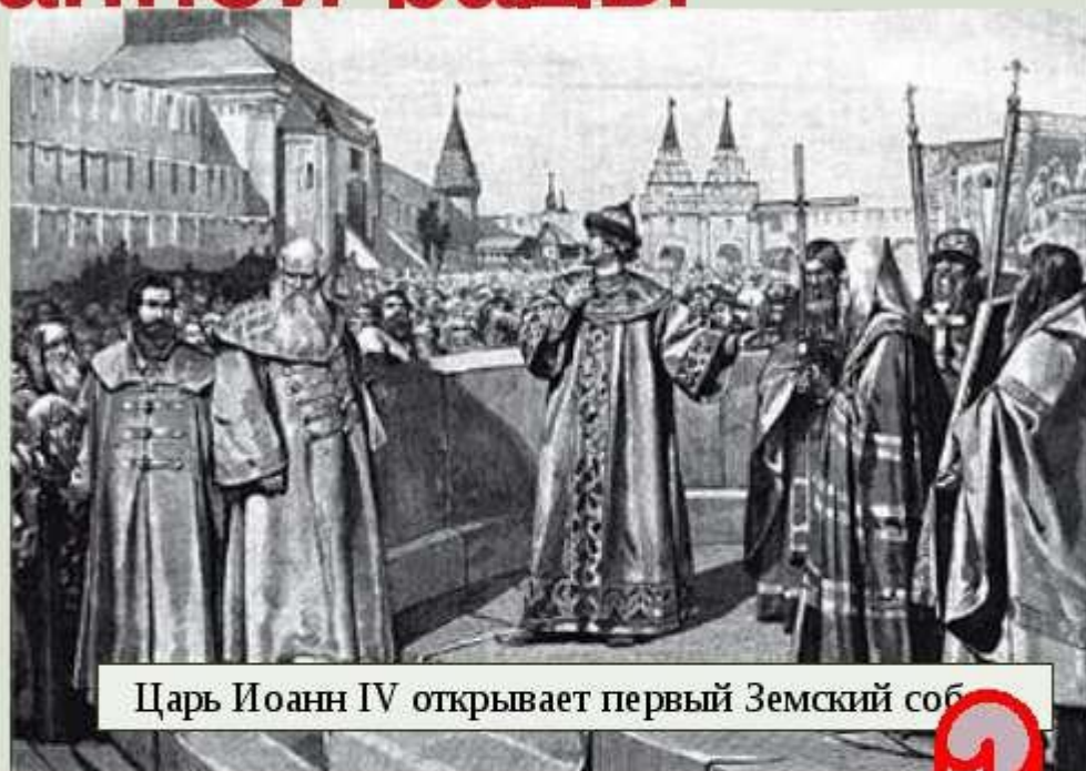
Царь Иоанн IV открывает первый Земский собор

В середине XVI века в России сложился аппарат государственной власти в форме сословно-представительной монархии